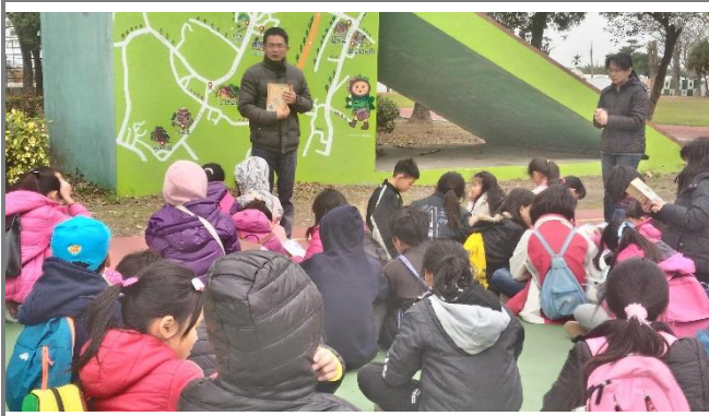
準備整隊出發參觀