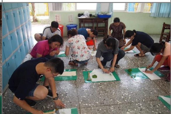
老師們實作 3(敲打其他葉片)