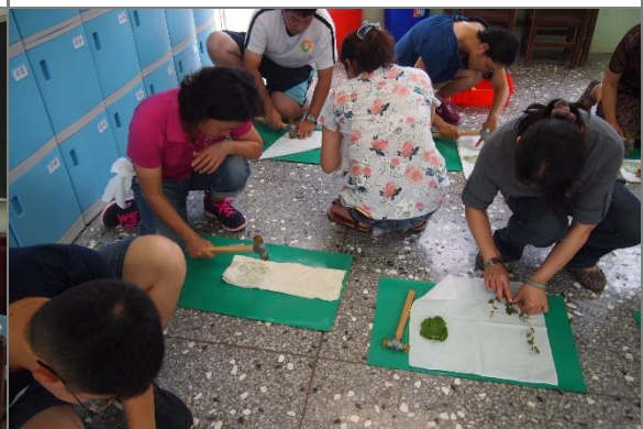
老師們實作 1(敲打葡萄葉)