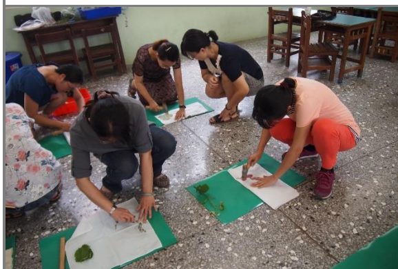
老師們實作 2(敲打其他葉片)