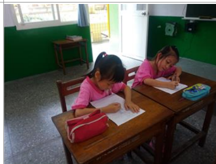
學生們也努力靜心完成 Old MacDonald Had a Farm 學習單