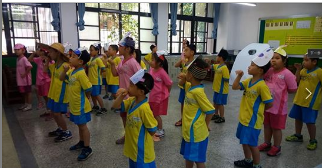
全班同學專注的學習英語歌謠搭配動作。