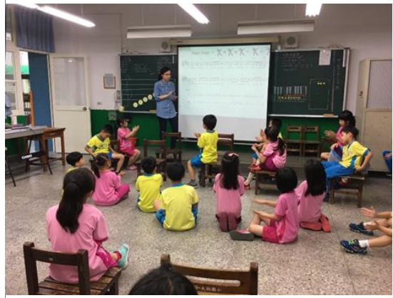
師生共同討論樂曲段落，間奏音樂加入響板伴奏，練習間奏的節奏樂段。