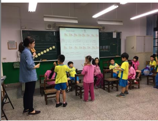
教師介紹高低木魚，與學生討論如何呈現不同音色，並請學生示範演奏。