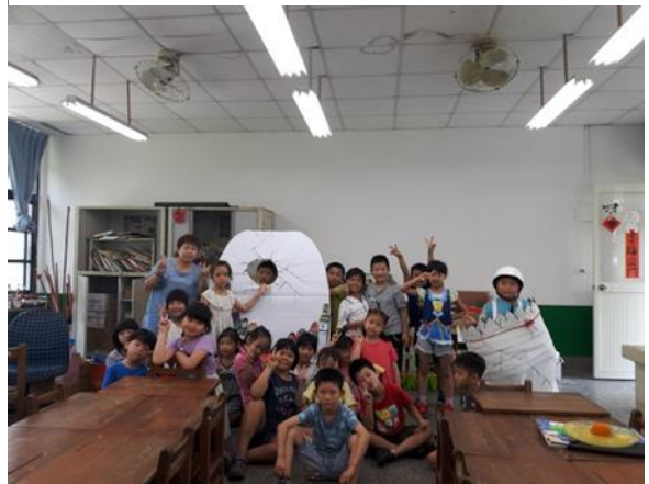
小朋友變身為 Humpty Dumpty 蛋頭人！大家一起在端午節慶立蛋祈福！