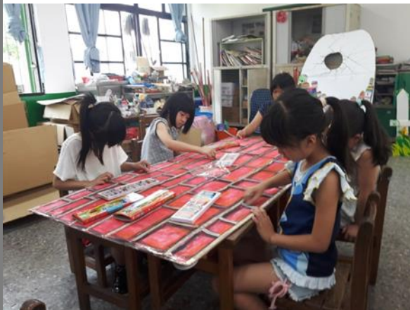
小朋友在跨領域課堂中學習分工利用水彩大面積創作，瓦楞紙拼貼成牆磁磚完成 Humpty Dumpty 城牆，及運用不同色塊創作迷你彩蛋，師生齊力共同完成立蛋英文歌曲的道具。