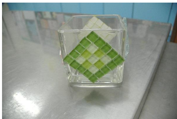
小朋友的馬賽克拼貼作品