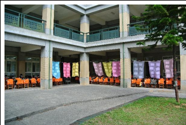
妝點校園與野餐地點