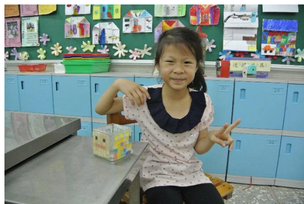
小朋友的馬賽克拼貼作品