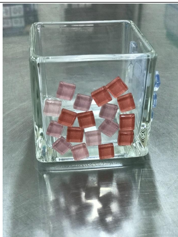
小朋友的馬賽克拼貼作品