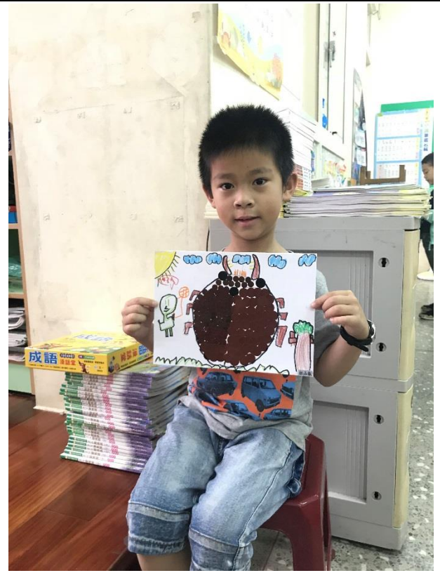
小朋友的點點貼畫