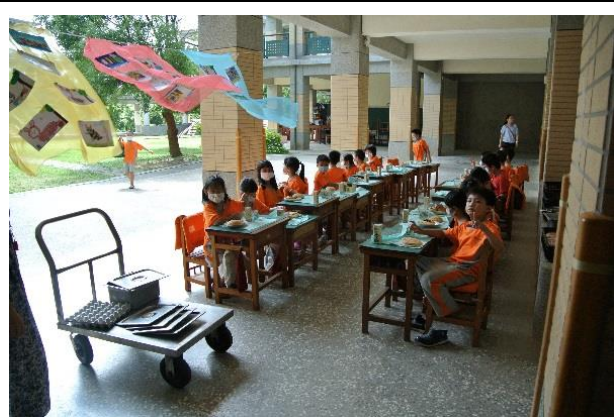
風兒吹拂，伴我製作三明治