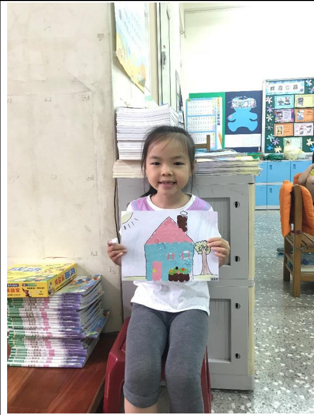
小朋友的點點貼畫