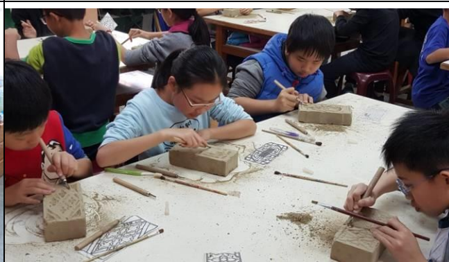
學生製作磚雕活動