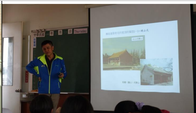
傳統磚瓦屋建築解說