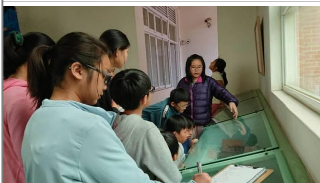
由學校導覽小尖兵解說傳統磚瓦屋建築