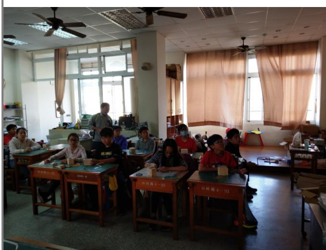
校園生活關鍵字找尋