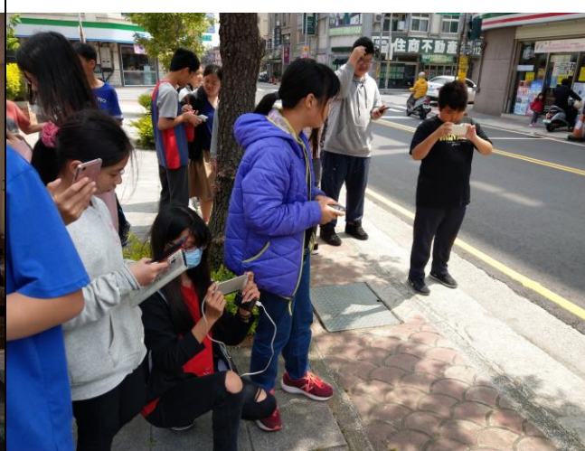
校園色彩蒐集活動