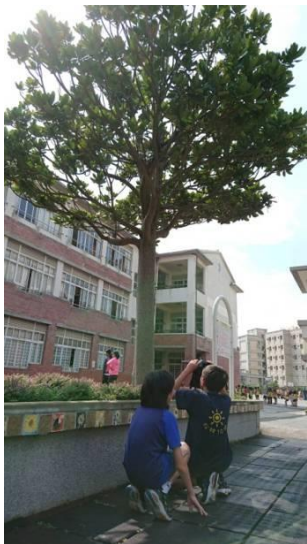
校園攝影學生實作活動