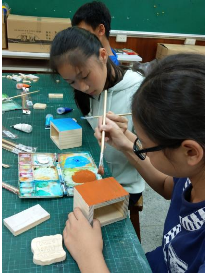
回憶音樂盒製作彩繪