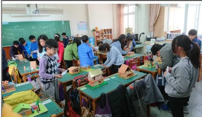
學生進行磚瓦屋評量