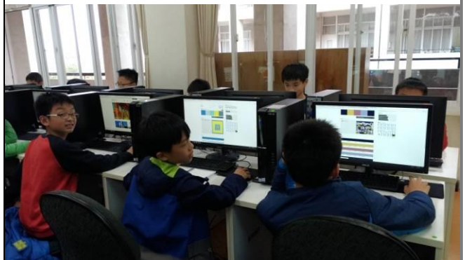
資訊課配色練習遊戲