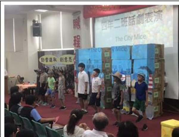
6/20 正式表演當天，學生認真的演出，博得滿堂彩。