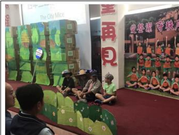
6/20 正式表演當天，學生認真的演出，博得滿堂彩。