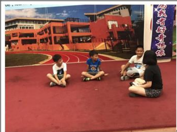
排戲時與學生討論角色的動作表情。