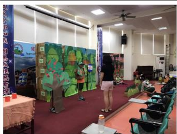
排戲時指導學生表演動作與走位。