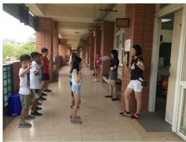
開始排戲之後，由表演藝術老師教導學生話劇裡舞蹈的部分。