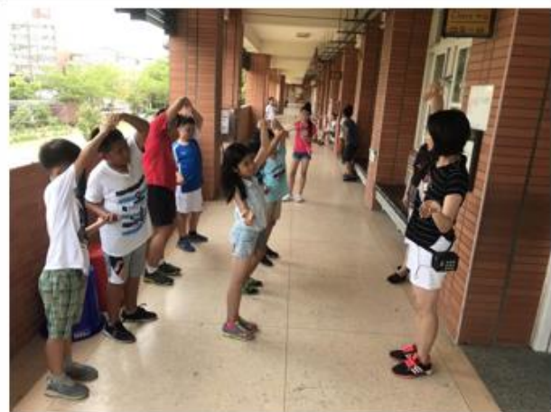
開始排戲之後，由表演藝術老師教導學生話劇裡舞蹈的部分。