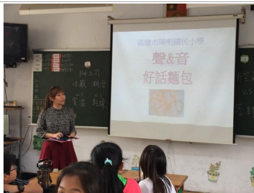
● 聲音&麵包的課程解說