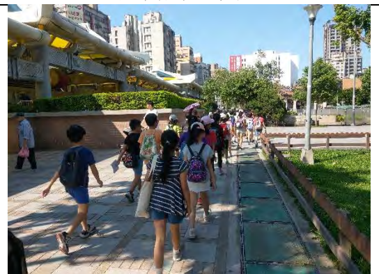
龍山寺前噴水廣場