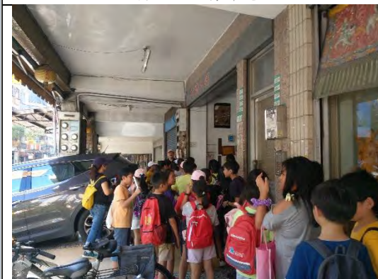
萬華老街商家簡介