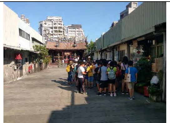
祖師廟前格局介紹