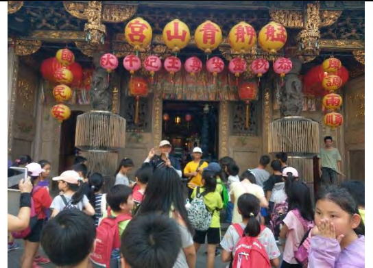
青山宮面前解說觀察重點