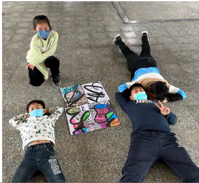
學生彩色纏繞 作品