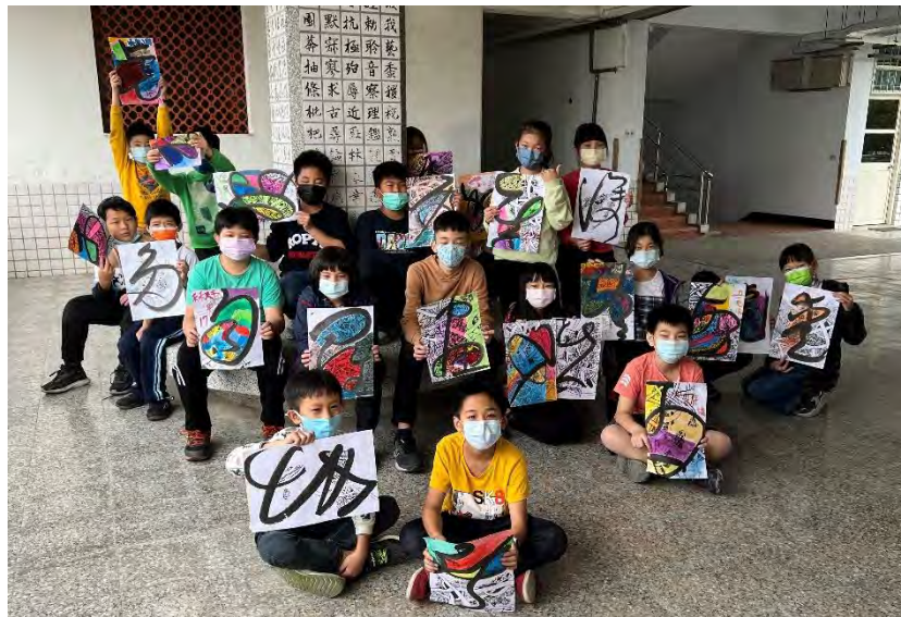
學生彩色纏繞 作品