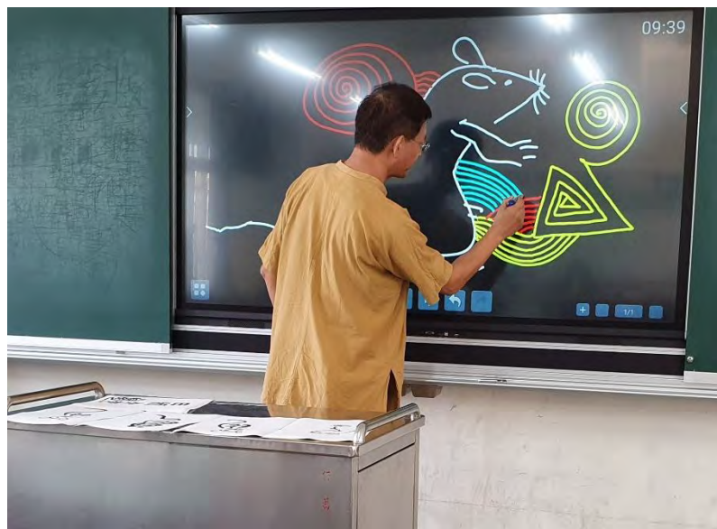
示範運用資訊 工具創作彩色 禪繞