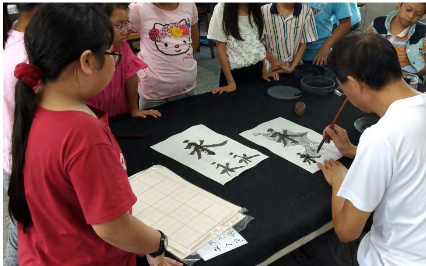
禪繞畫線條及 圖案的組成示範