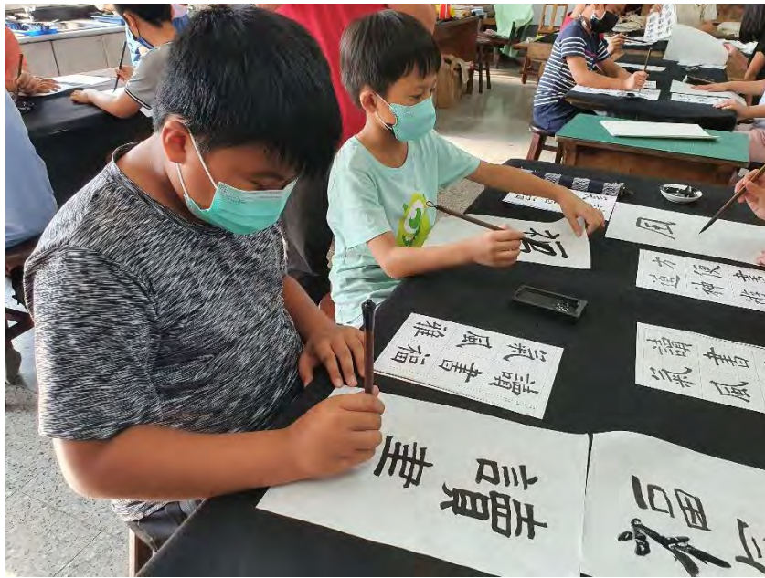
學生自選詞語 習寫