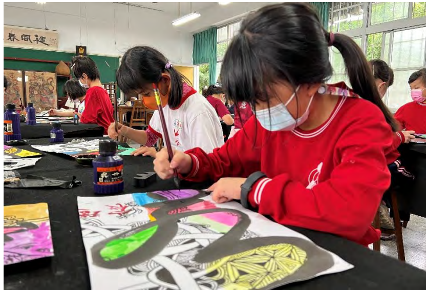
書法、色塊與 禪繞結合創作