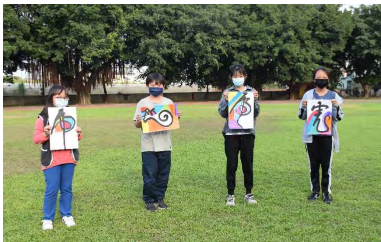
書法與色塊結合創作成果