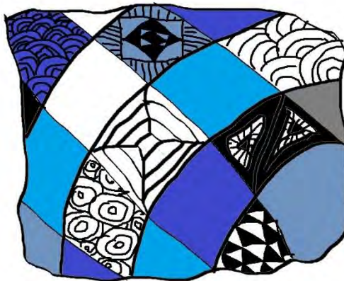
學生使用小畫家創作作品