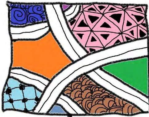
學生使用小畫家創作作品