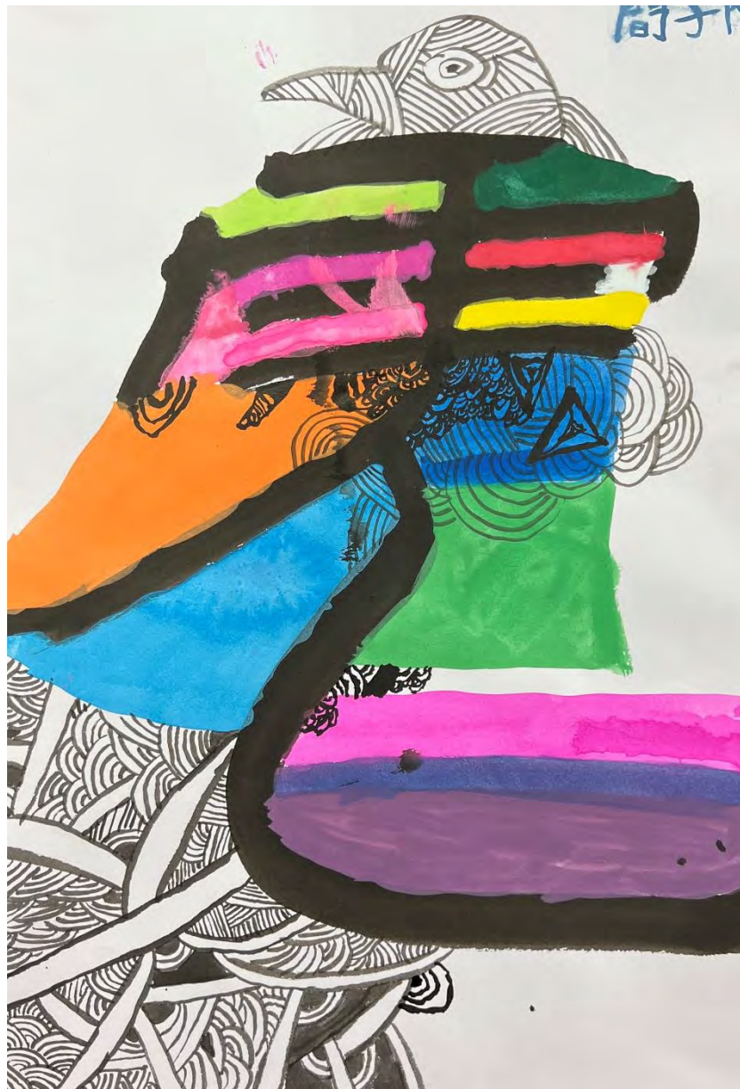
學生彩色纏繞 作品