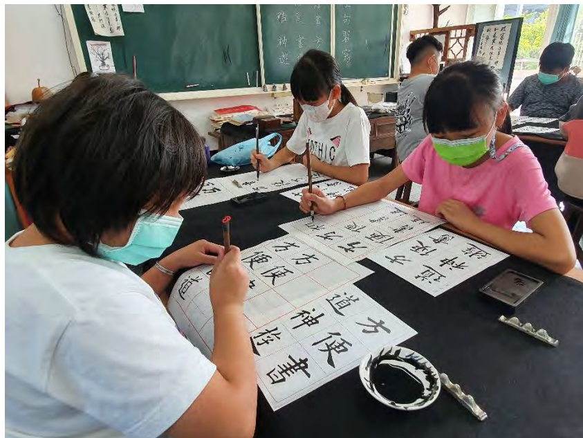
學生以九宮格 習寫語詞