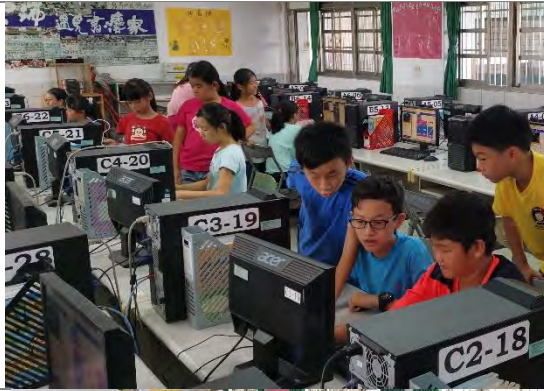
學生使用電腦創作禪繞書法