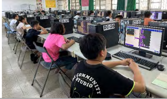
學生使用電腦創作禪繞書法