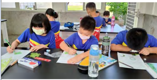
學生繪製植物觀察記錄學習單