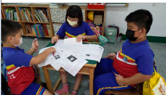
學生練習整理資料