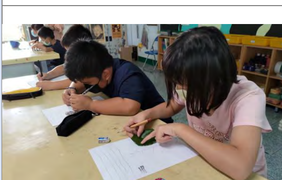
學習植物繪製的技巧