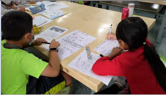
撰寫小書內容與美編