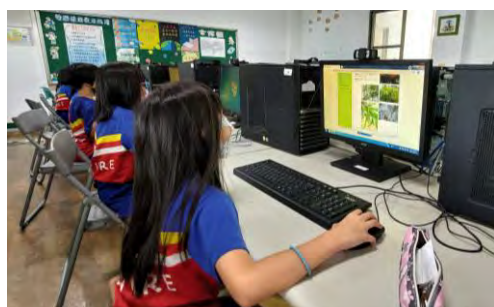
學生使用電腦蒐集與植物相關資料