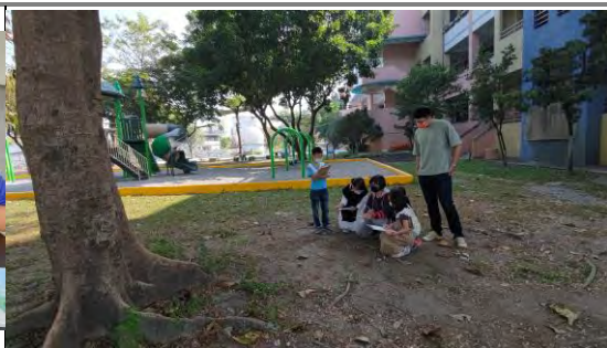
到校園內繪製植物的莖