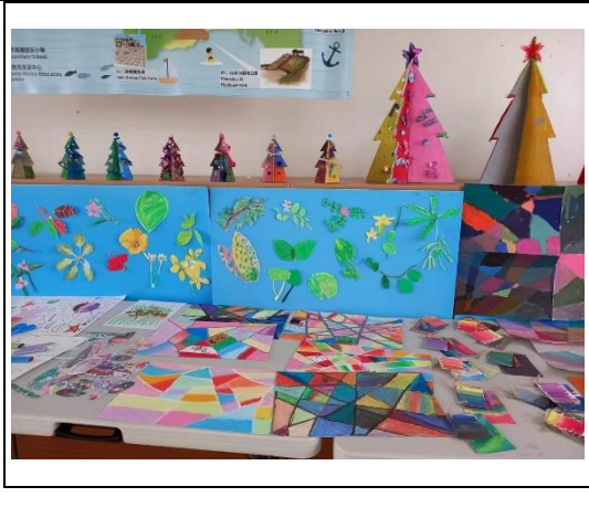
展示學生植物插畫與創作作品