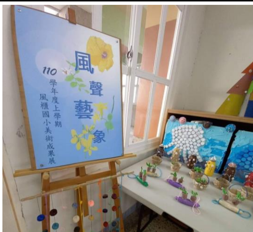
學校辦理期末美術展覽