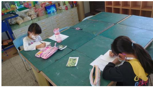
上色前要先進行構圖