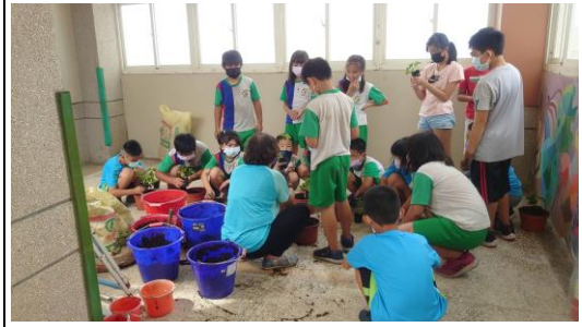
老師讓學生親自種植植物(草莓)