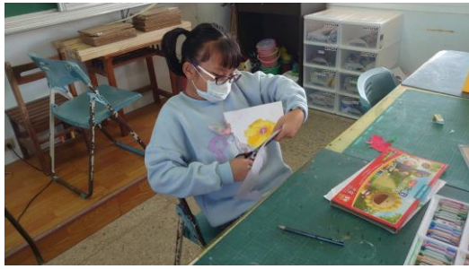
學生將植物插畫剪下