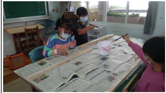
學生將植物解說牌木頭部分進行處理