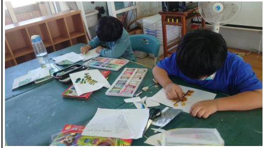
學生仔細描繪植物構造