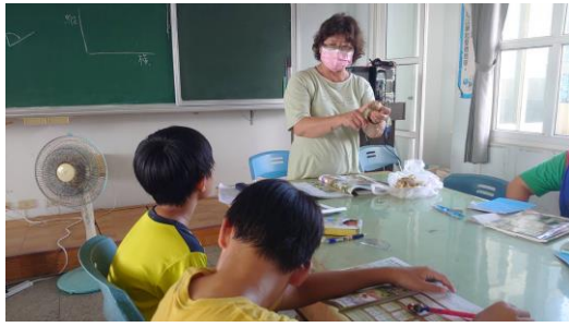
老師以地瓜為例介紹不同植物的特性