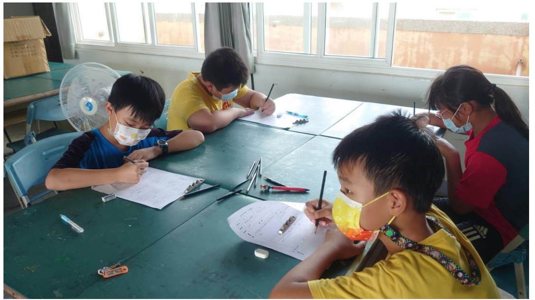
學生進行劇本創作