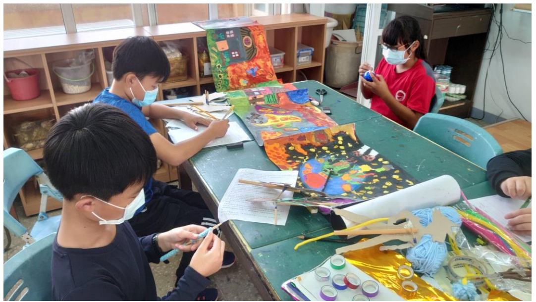
學生邊修改劇本邊製作配件