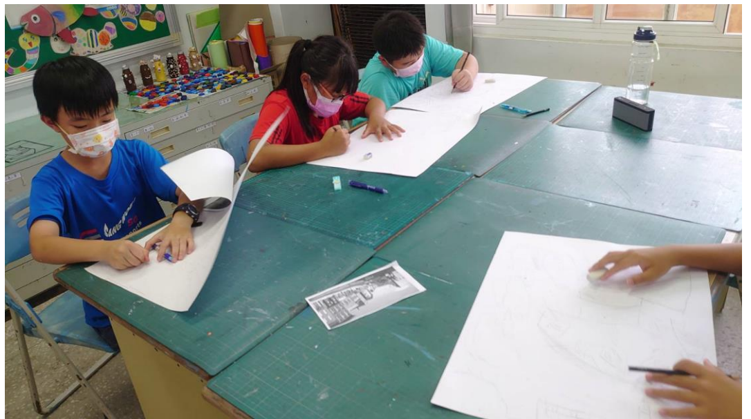
學生繪製場景圖，畫紙彼此靠攏一同創作