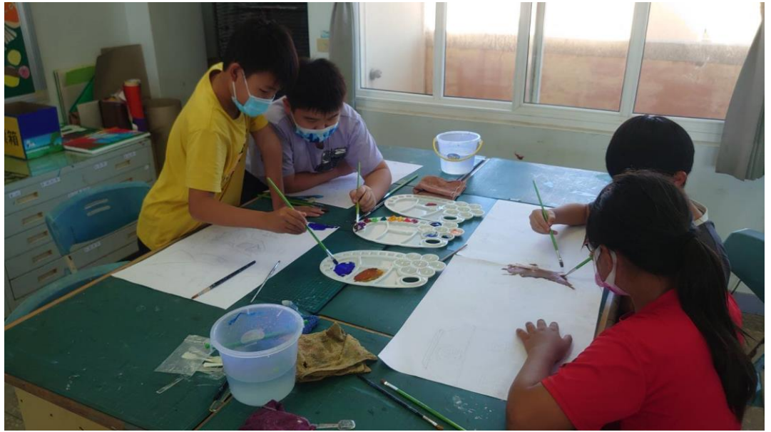
學生繪製場景圖，畫紙彼此靠攏一同創作