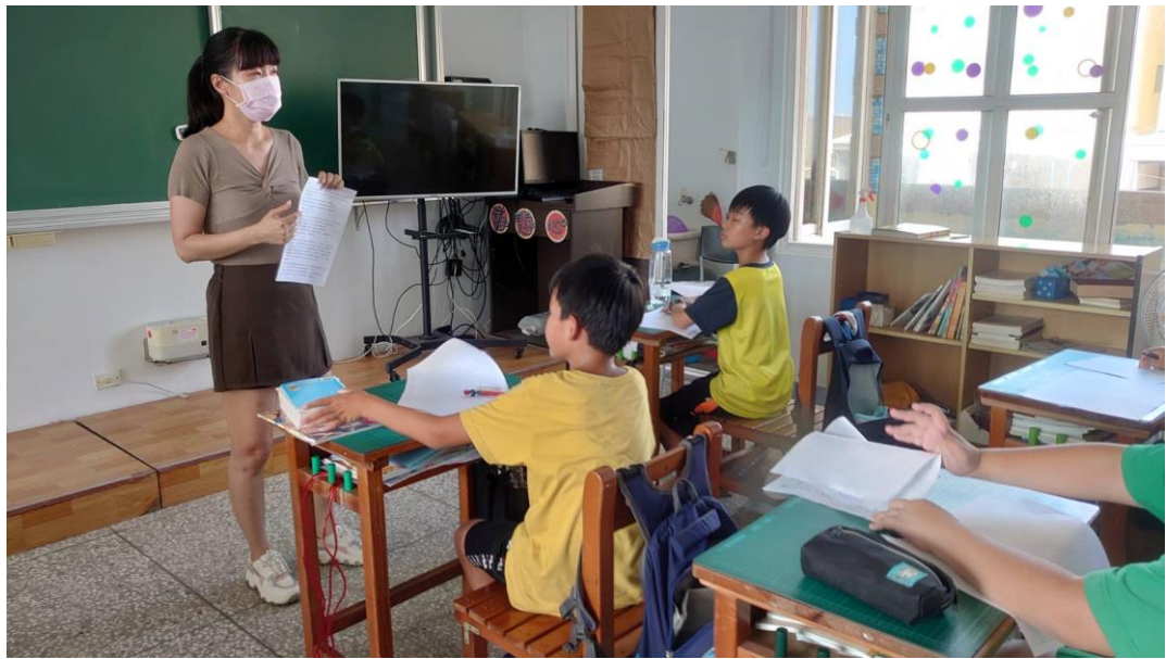
老師複習劇本格式並指導學生劇本創作