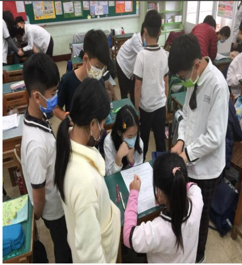
學生討論團體跳繩賽時遇到的困難、解決的方法和紀錄練習過程，尋找成功的法則。