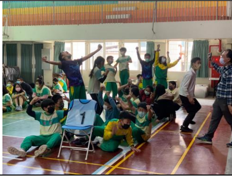
跳繩團體賽獲得冠軍，開心得手舞足蹈。