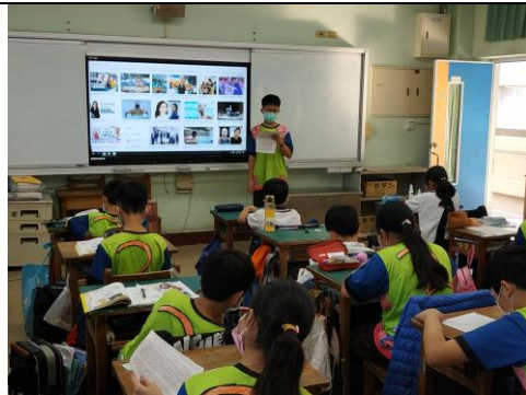
學生發表對「運動家精神」的看法。