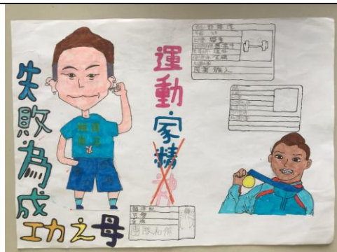
學生「運動家精神」的心智圖。