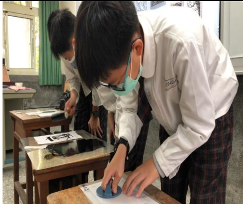
運用版畫製作藏書票，將校慶活動是創作主題，此為學生印製版畫的過程。