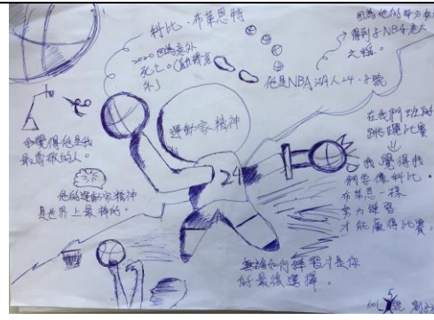
學生「運動家精神」的心智圖。