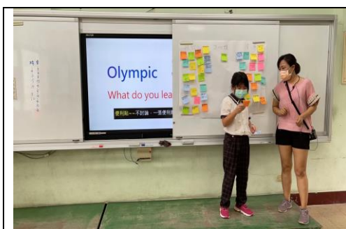
學生發表對「運動家精神」的看法。