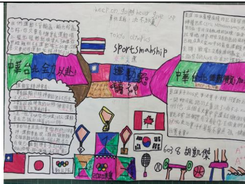
學生「運動家精神」的心智圖。