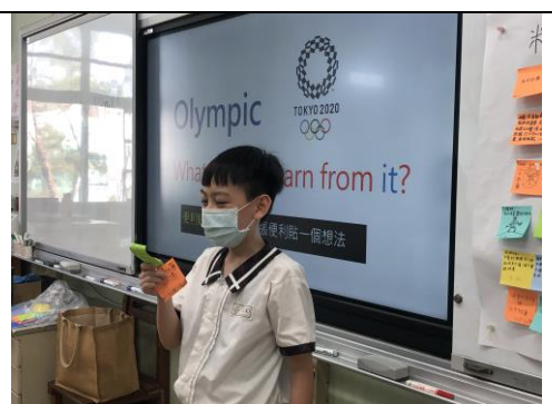
學生發表對「運動家精神」的看法。