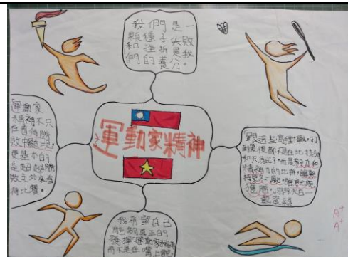
學生「運動家精神」的心智圖。