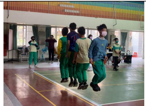
跳繩團體賽比賽中的情形。