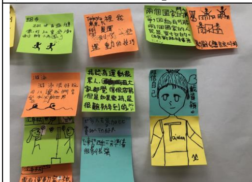
學生發表對「運動家精神」的看法。