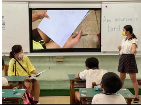
運用電子白板的直播功能示範如何進行動態人物速寫。