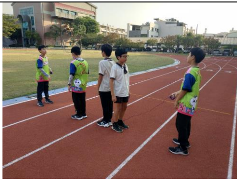
跳繩團體賽需要相當的默契，所以要不斷的練習。