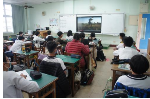
學生觀看影片「旅程」及泰國勵志影片，建立對奧運、難民隊、運動家精神的想法。