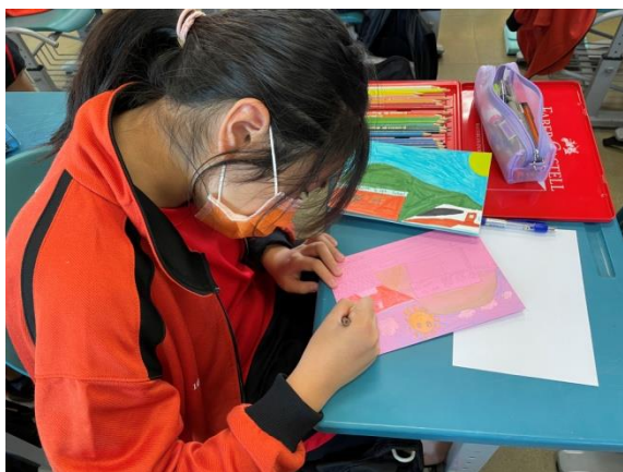
學生專心製作卡片