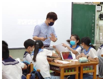
校長親自授課 APP 操作