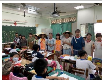
有練有差，真的自信多了!