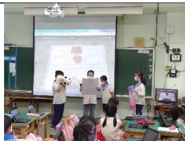
記者連線報導旗山老街