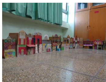
全班一起做出整條老街喔!