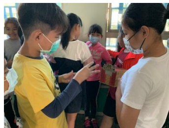
我的選擇是最好的，選我啦!