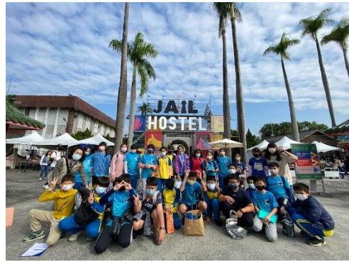
台灣設計展參觀合影