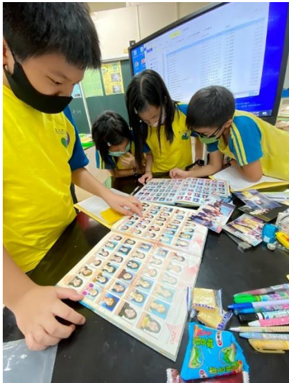
尋找附小記憶印象