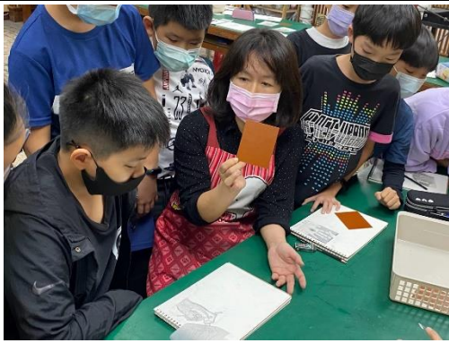
版畫專家入校指導