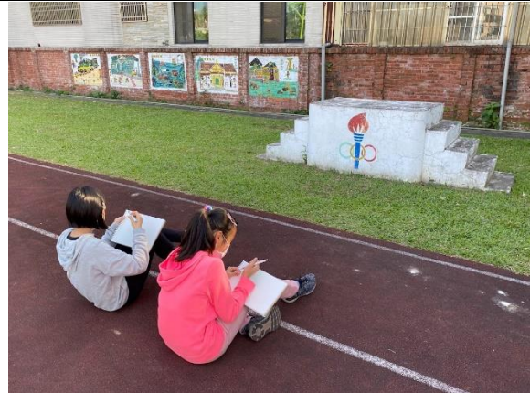
附小記憶印象寫生