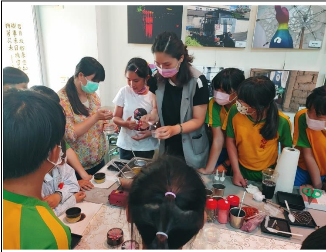
學生學習果凍花的製作 1