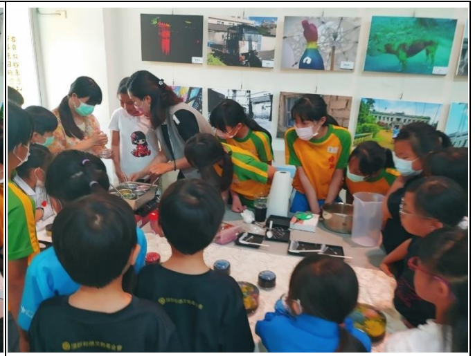
學生學習果凍花的製作 2