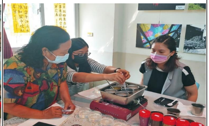
老師指導社區家長製作果凍花 2