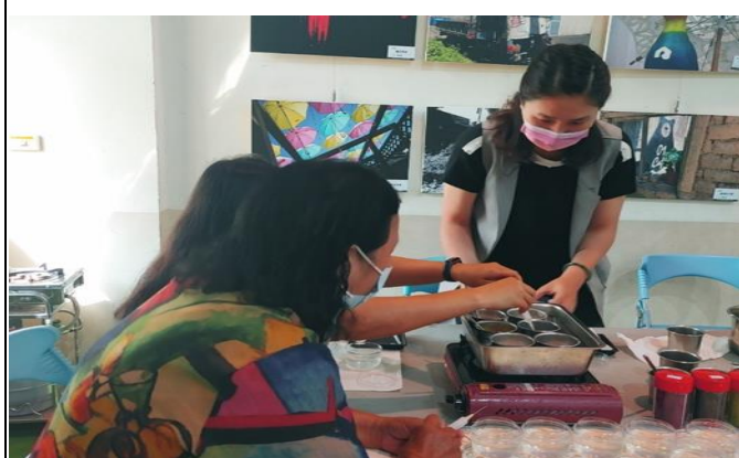
老師指導社區家長製作果凍花 1