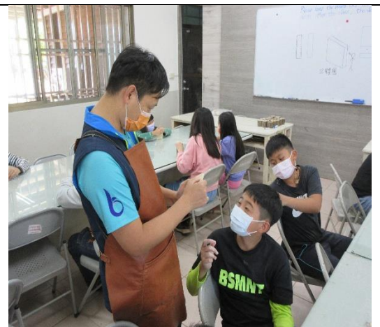
木工磨製技巧示範