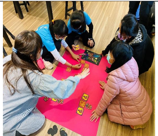
製作動畫背景海報