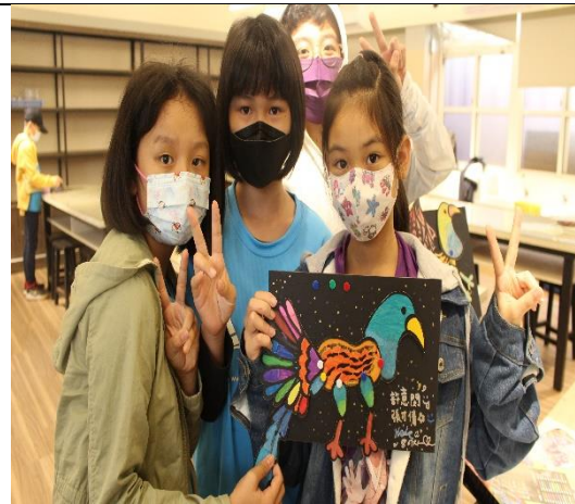
動畫主角-鳥玩偶完成囉!