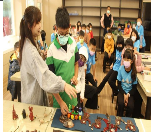
老師講解動畫素材