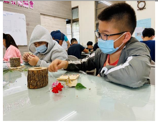
校園花草、樹葉均是創作材料