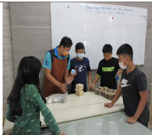
老師教導學生如何用樹枝製作盆栽