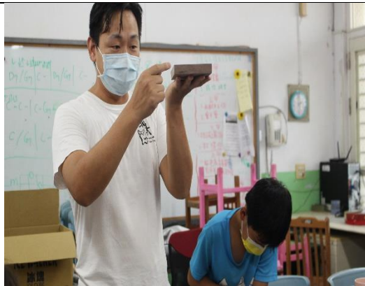
老師講解卡林巴琴製作要領