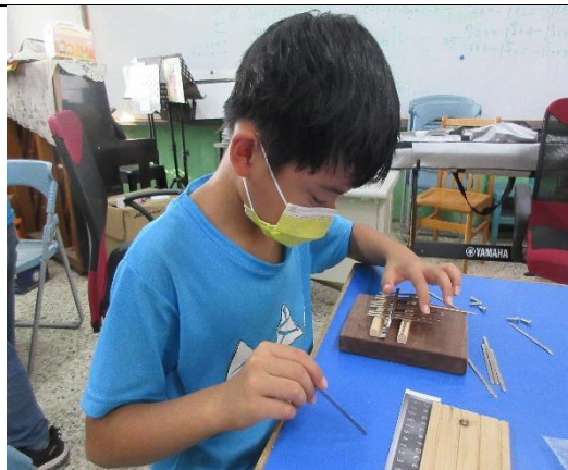
琴鍵的排列也是一門藝術