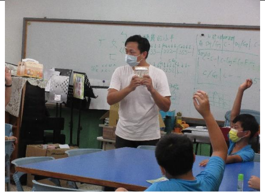
藝來做卡林巴琴吧!