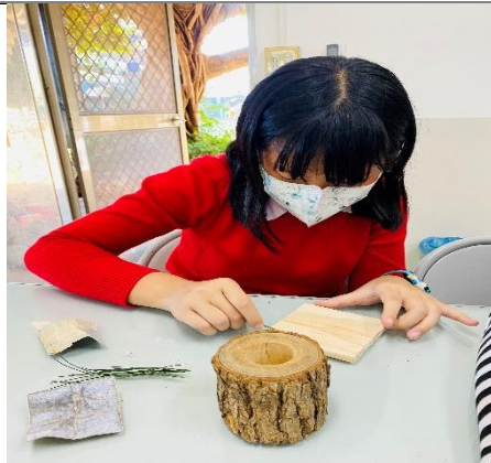
學生利用校園素材製作創意盆栽