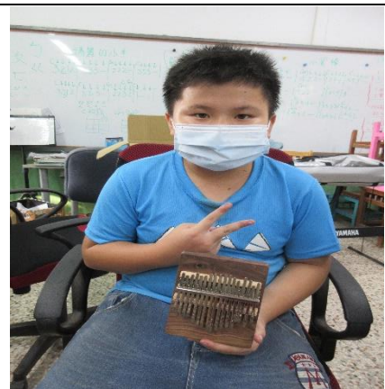
跟自己的卡林巴琴合照吧!