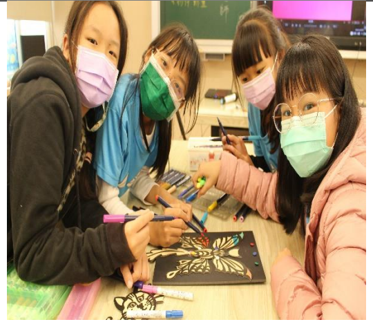
學生利用蝴蝶製作動畫主角紙玩偶