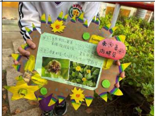
學生設計製作植物解說牌