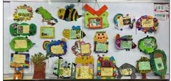
全班完成植物說明解說牌