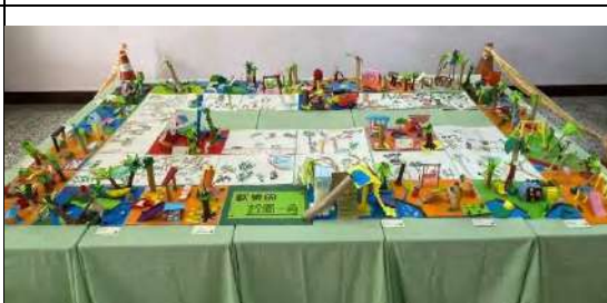
透過展覽學習分享及主題營造，也提升學生的成就感。