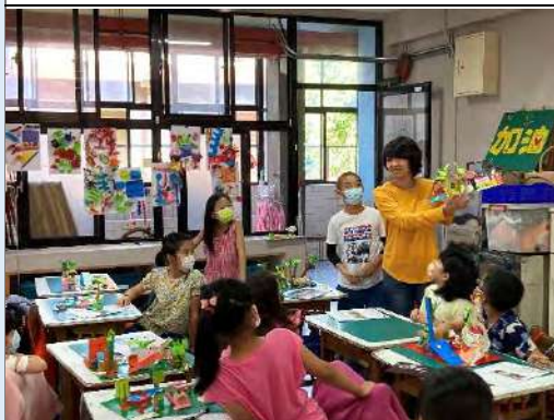
教師與學生針對作品進行分享及討論