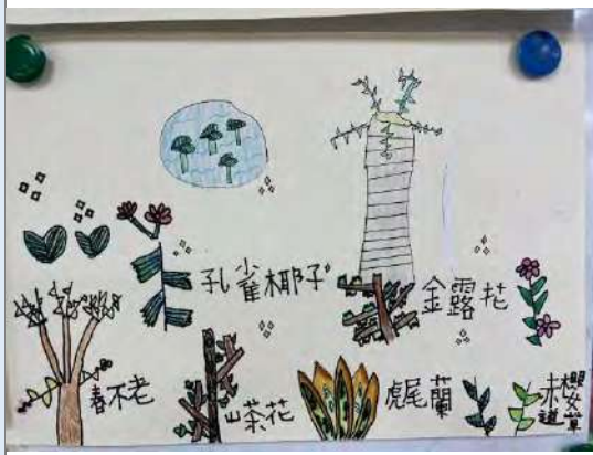
學生速寫作品，學生為方便記憶自行寫上名稱