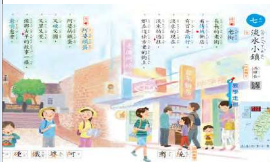
課文延伸教學，引導寫作架構