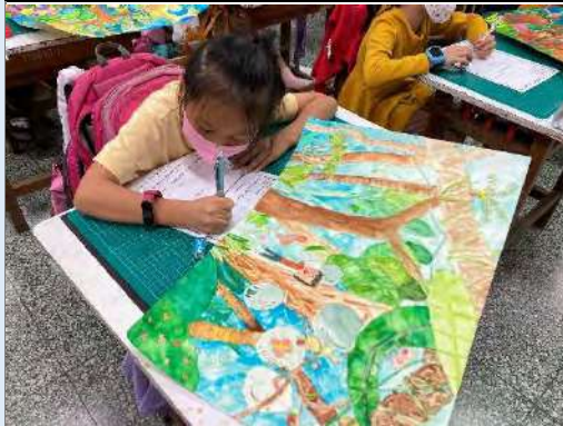
學生進行作品解說單撰寫