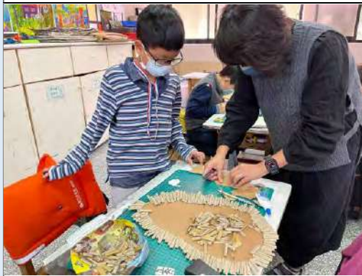
教師指導學生進行創作