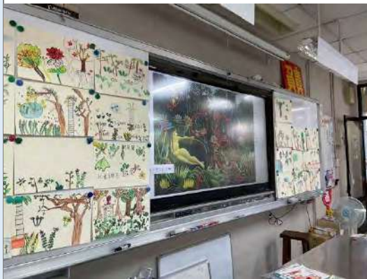
教師以 ppt 進行引導教學