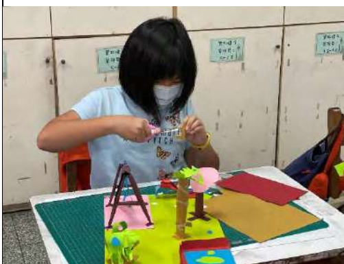
學生進行校園遊戲器材的想像創作