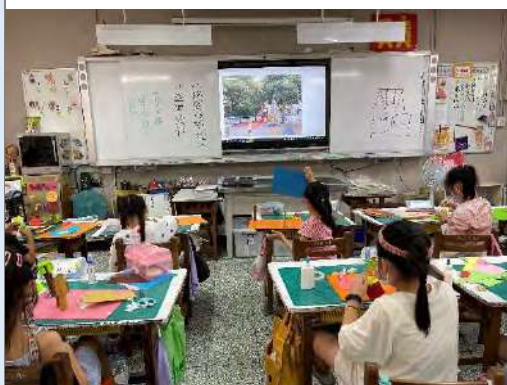
教師進行引導創作