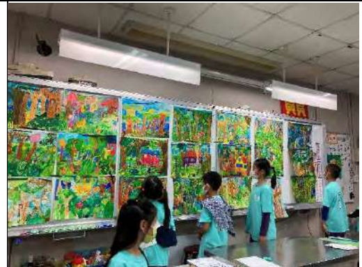
全班一同作品並進行互評