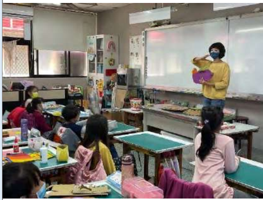
教師進行作品製作的調整