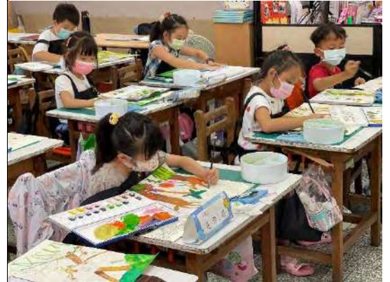
學生進行想像創作