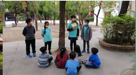
邀約一年級的學弟妹擔任觀眾，各組針對所負責的植物實地進行導覽與 Q&A 互動