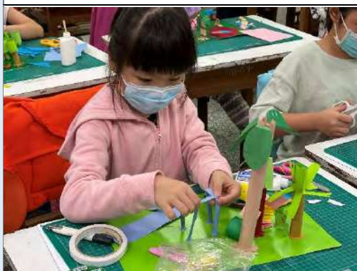
學生將校園中的植物透過紙張變形進行創作