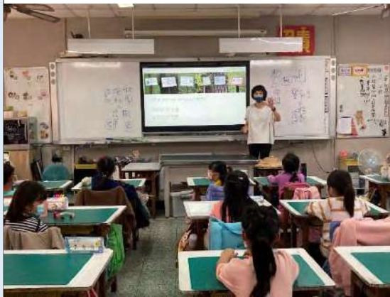
教師進行解說牌引導