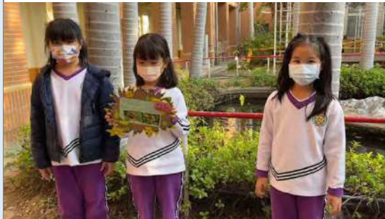
學生到植物前練習植物解說