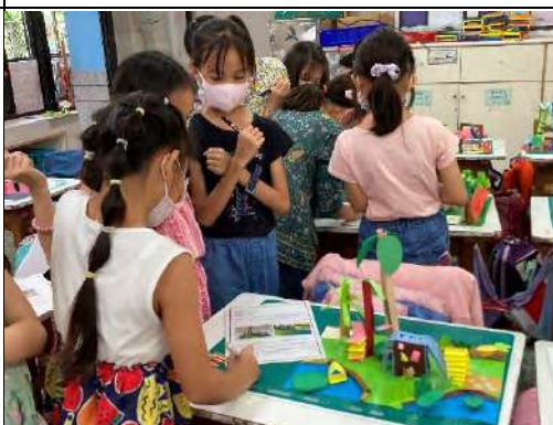
學生進行作品欣賞及互評