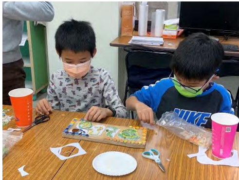
植物立牌-黏馬賽克磚