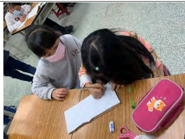
植物立牌-設計草稿