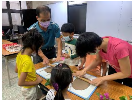
植物石膏翻模-將陶土壓平