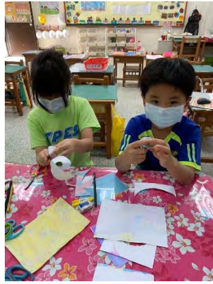
浮水畫玫瑰花-捲成玫瑰花