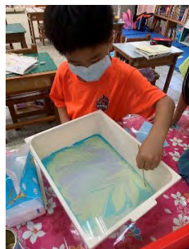
浮水畫玫瑰花-畫上花紋