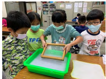
乾燥花書籤-製作手工紙