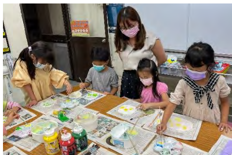
植物石膏翻模-塗上顏料