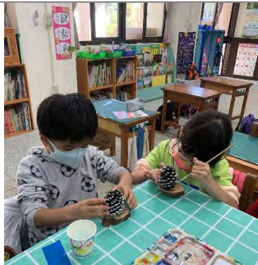
松果聖誕樹-塗上白色顏料