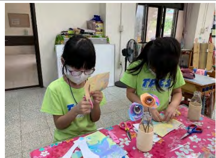
浮水畫玫瑰花-將紙張剪成螺旋狀