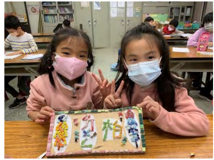
植物立牌-與半成品合照