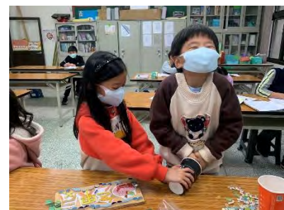
植物立牌-動手剪馬賽克磚