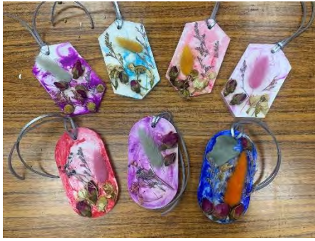
乾燥花擴香石成品