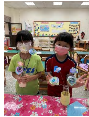
浮水畫玫瑰花-與成品合照