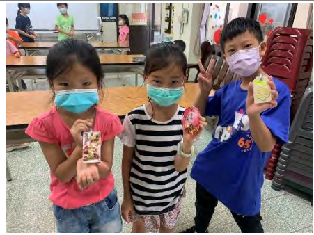
乾燥花擴香石-與作品合照