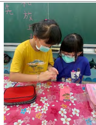
乾燥花書籤-黏上乾燥花