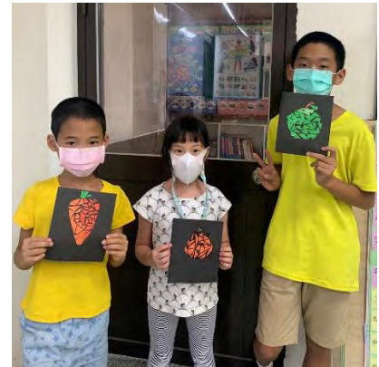
植物拼貼畫-與作品合照