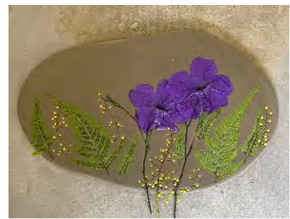
植物石膏翻模- 將植物放到陶土上並輕壓留下紋路