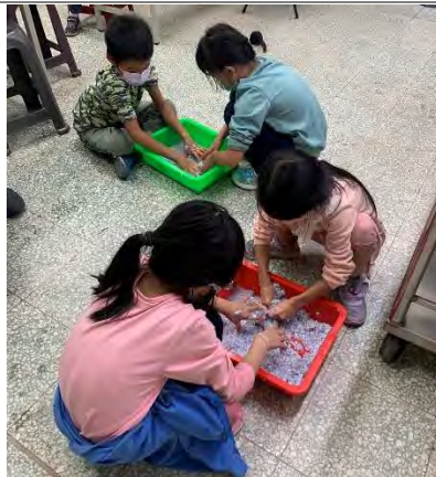
乾燥花書籤-製作紙漿