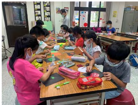
植物拼貼畫-動手創作