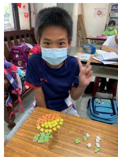
植物立牌-動手創作