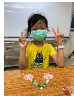
植物立牌-動手創作