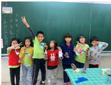
松果聖誕樹-與作品合照