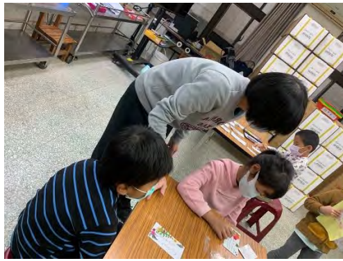
乾燥花書籤-寫上一句鼓勵的話