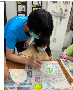
植物石膏翻模-塗上顏料