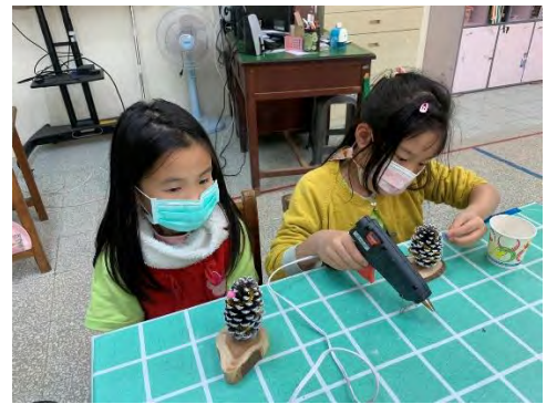
松果聖誕樹-黏上毛球