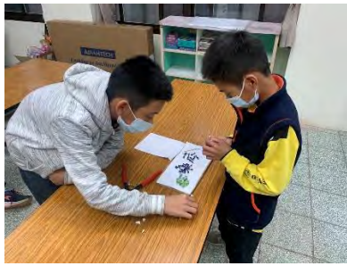
植物立牌-黏馬賽克磚