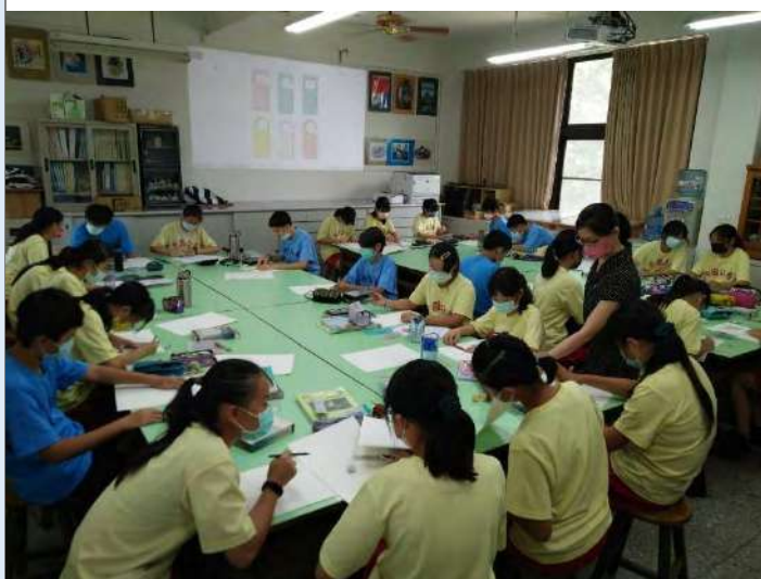
各小隊成員研擬主題草圖設計