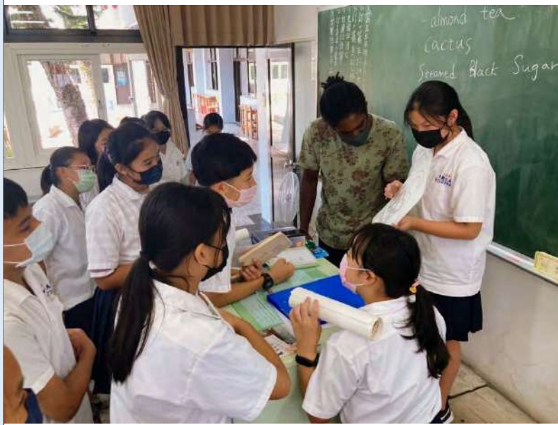
確認掛牌正確英文標語