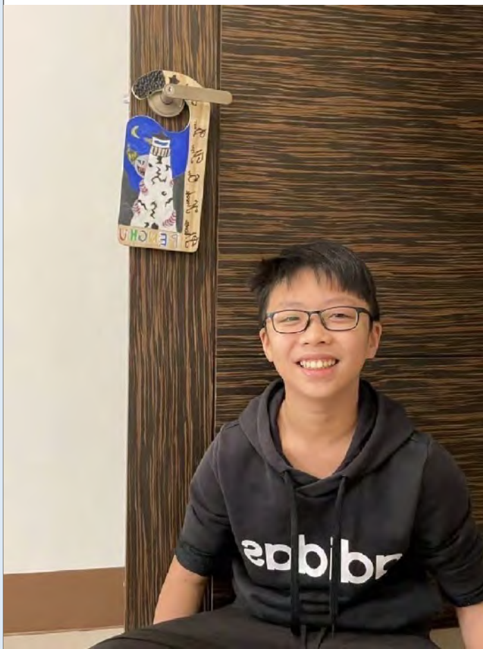
我的創作我的品味生活