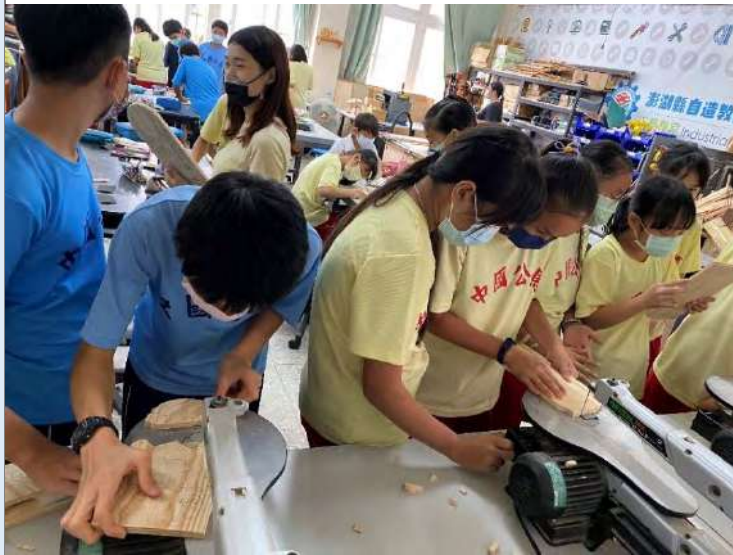
門把掛牌造型裁鋸