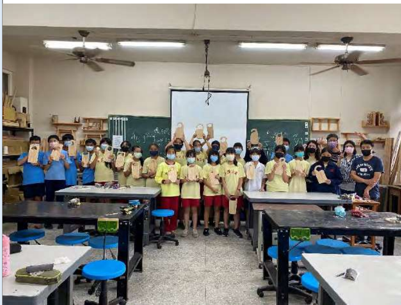
階段性成型作品大合照