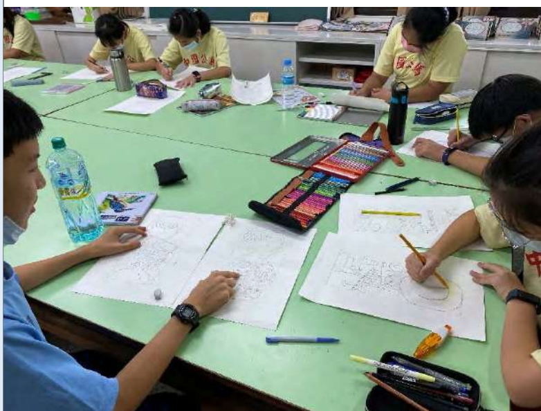
小隊成員設計圖繪製