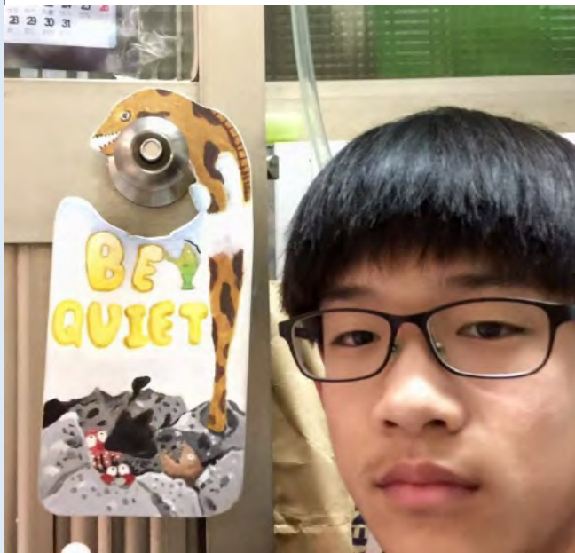
我的創作我的品味生活