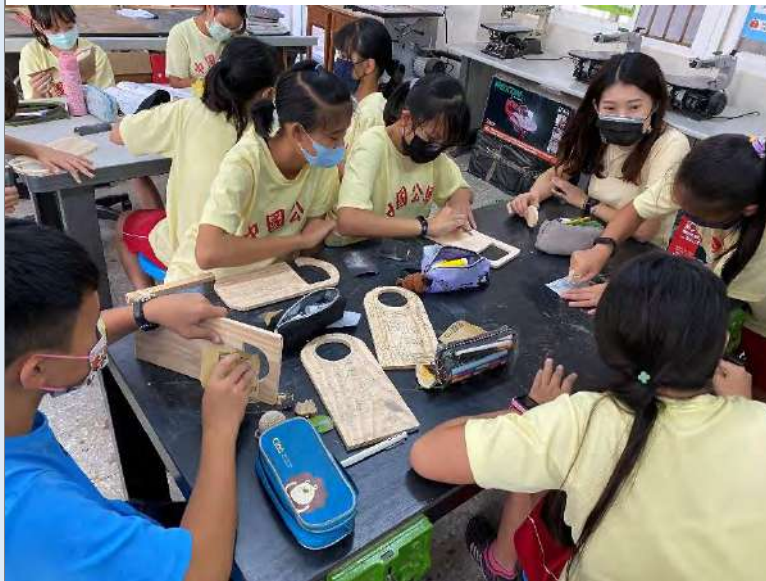
教師檢視各小隊進度