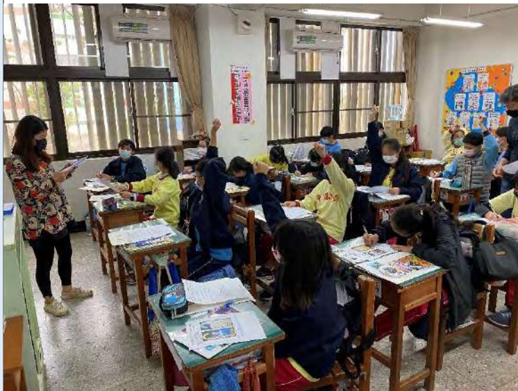
完成學習歷程檔案與學習單