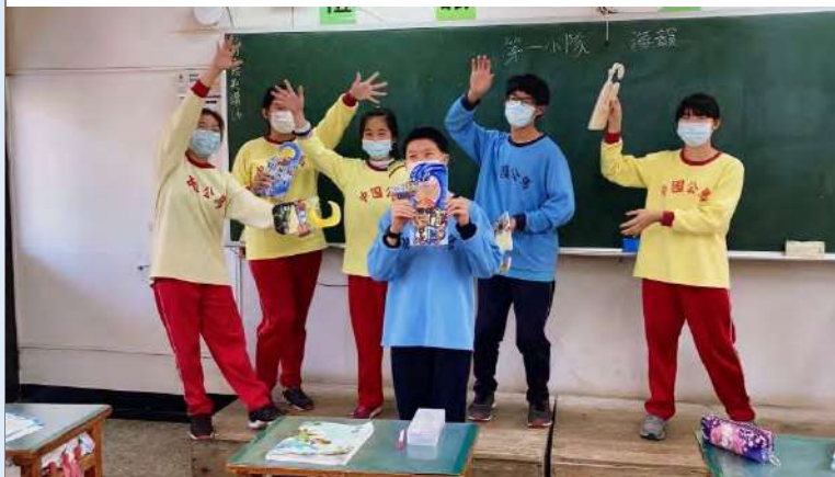
小隊系列創作成果發表