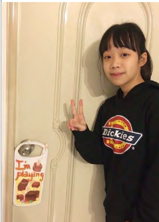
我的創作我的品味生活