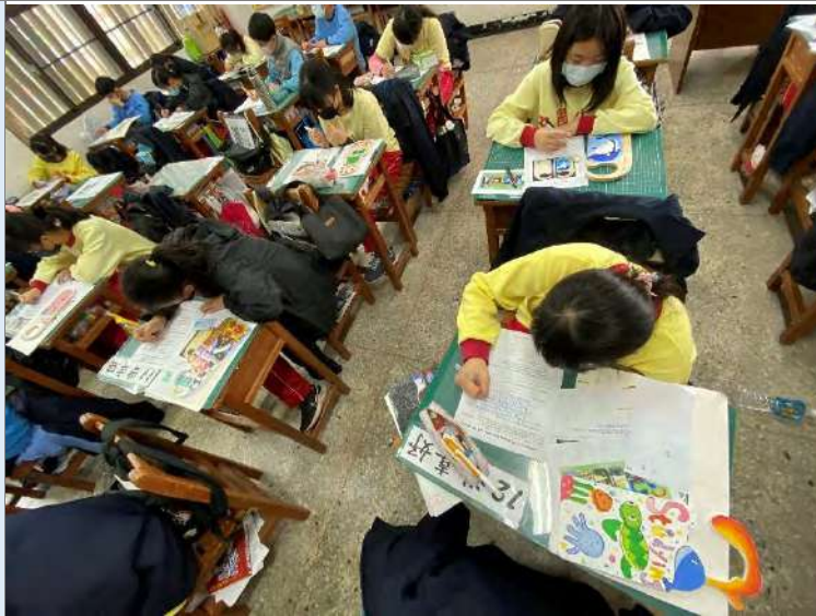
完成學習歷程檔案與學習單