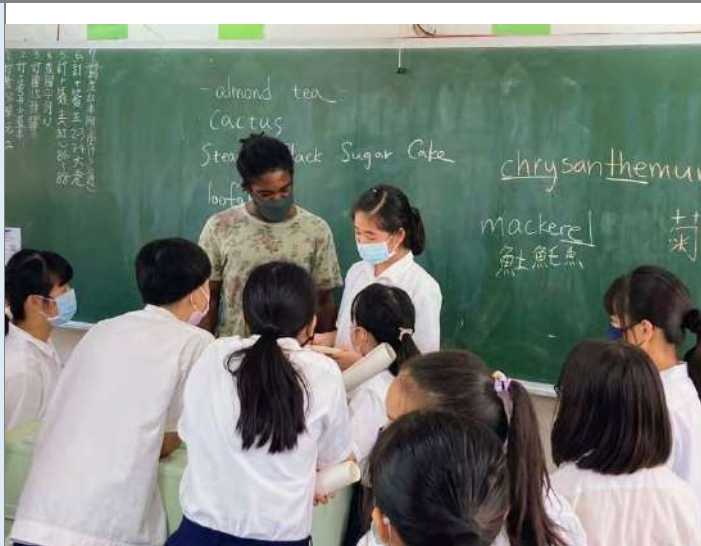
外籍教師介紹相關英文單字