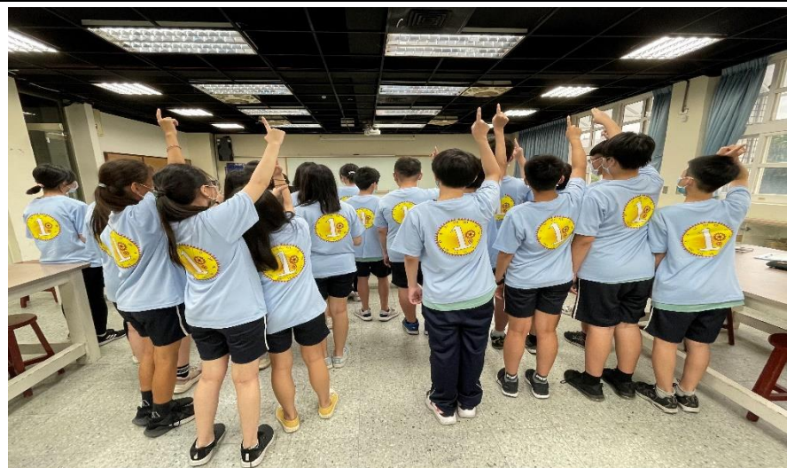
班服製作課程-成品