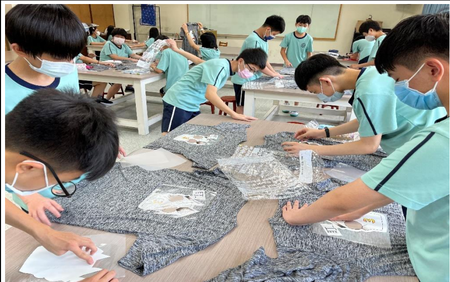
班服製作課程-噴切模