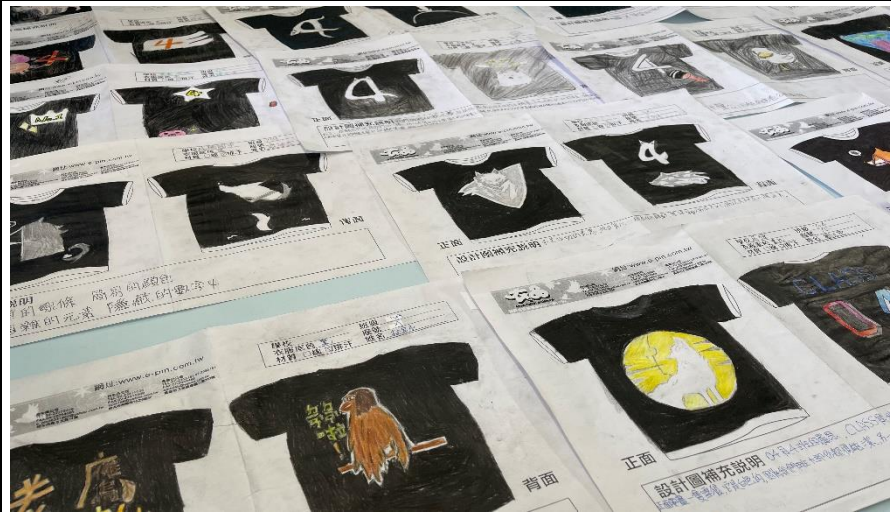
班服製作課程-設計