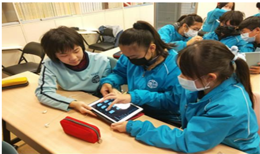
學生使用軟體創作個人作品