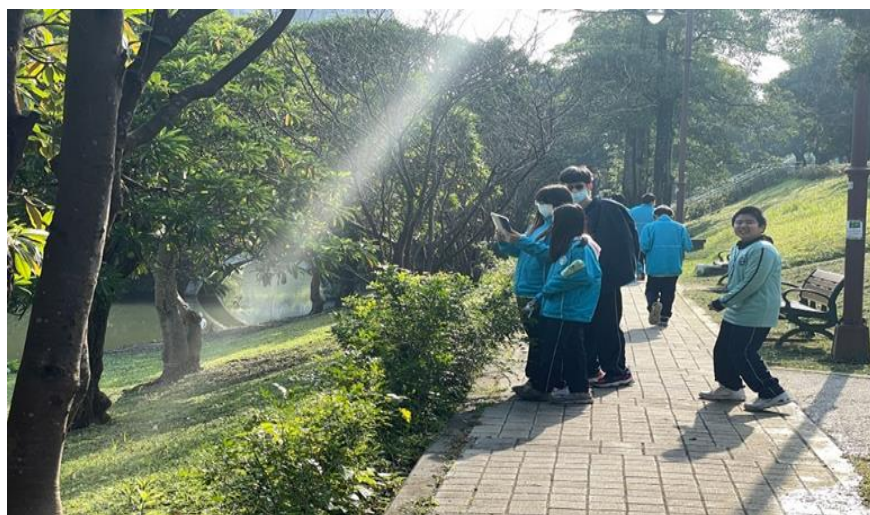
學生使用 ipad 製作植物聲景地圖