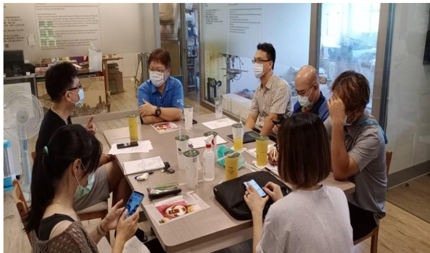
定期與藝術家開會共備讓課程更完整