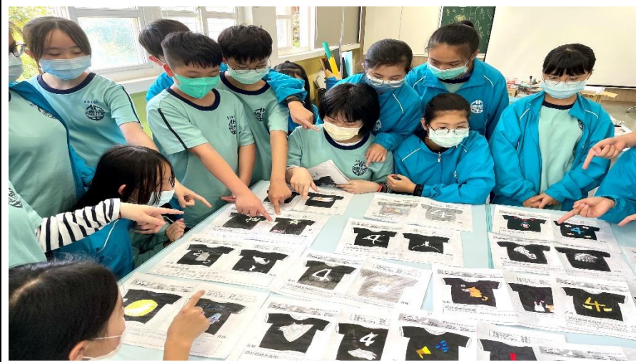
班服製作課程-選擇