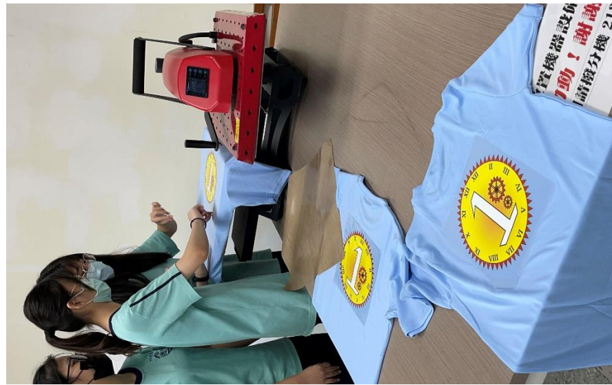
班服製作課程-噴切模轉印