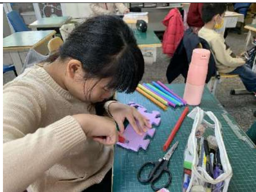
切割適合大小的巧拼墊..