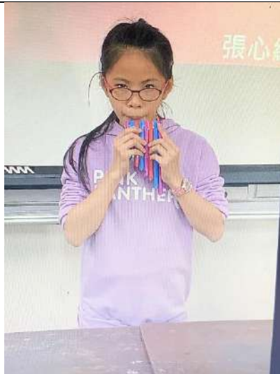
來...我會吹小星星喔!