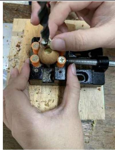
種子內部等待挖空的果仁..