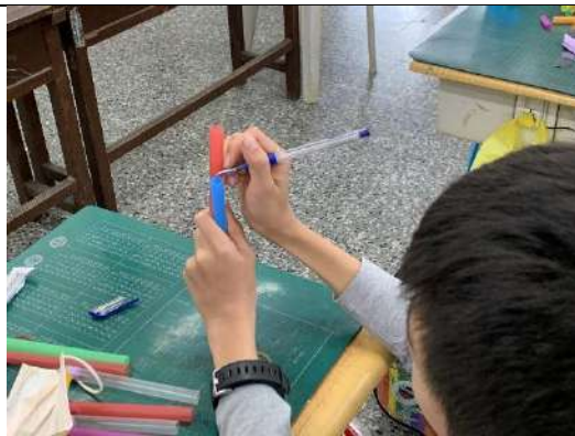
在吸管上面做記號