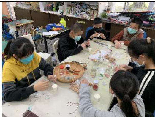
開始手鍊加工廠囉!