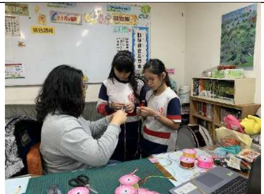
學習打中國結的兩妹