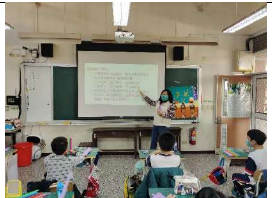
講解所需要的材料與吸管長度