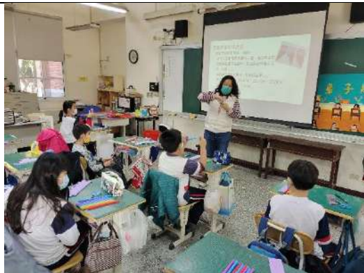
先介紹一下排笛的歷史