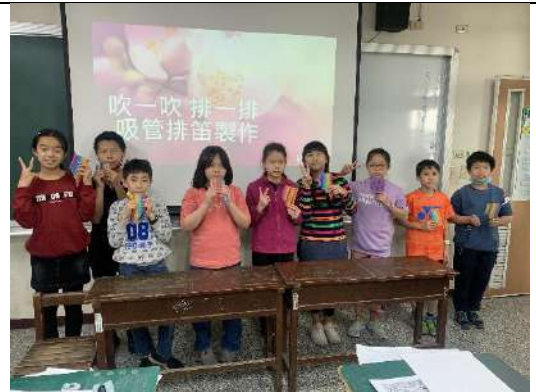
終於... 大功告成啦! 讓我們合影一下吧!