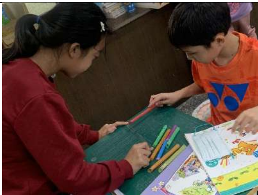
2人一組，利用透明膠帶將吸管排笛組合起來！