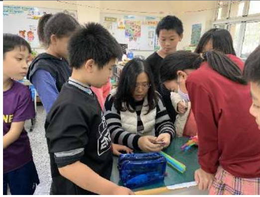
我先教導學生利用尺量長度