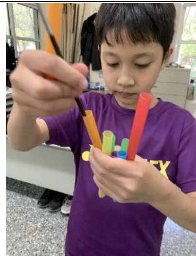
調音完，發現不太準，可以利用水彩筆穿進吸管，推動巧拼墊