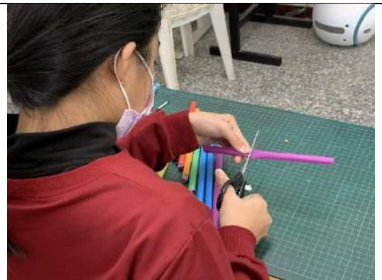
因為粗吸管比較硬，所以要剪時，需要稍微壓扁一點再剪