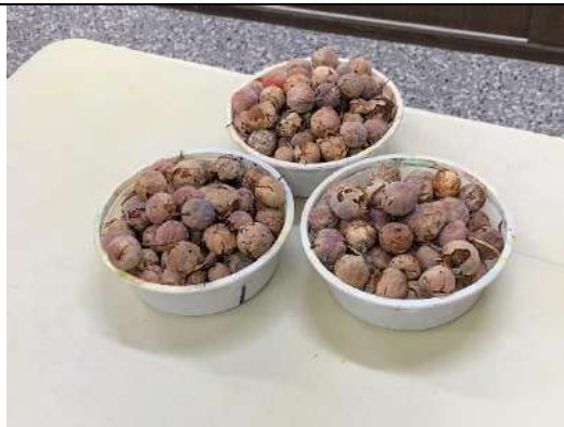
要來拿做鷹哨的種子..