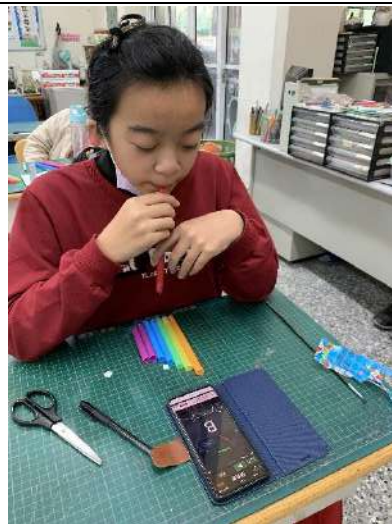
利用調音器 APP 來調音