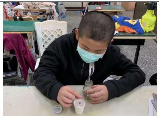
選擇自己喜歡的串珠..