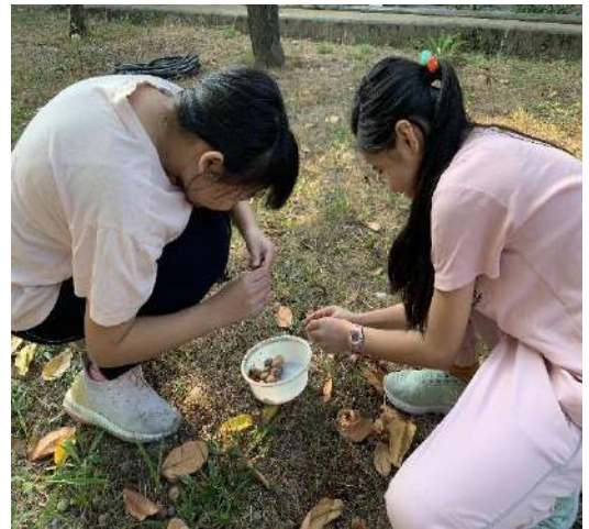
撿拾瓊崖海棠的種子