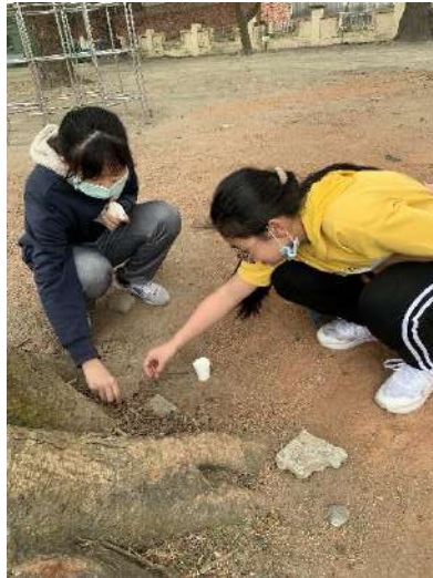
撿拾校園裡的種子..