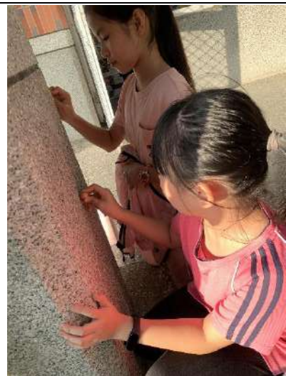
利用磨石子牆壁磨光..