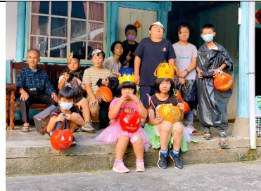
前往社區居民家中唱歌拿糖果