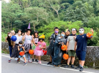
學生出發至社區遊行