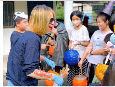
關卡2：扮鬼臉獲取糖果