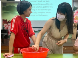
老師講解示範咬蘋果遊戲