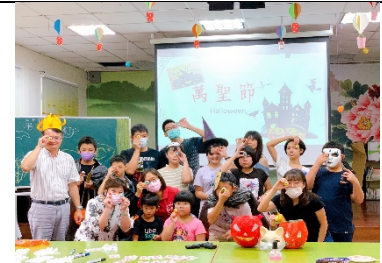
遊行圓滿結束，學生帶著滿滿的糖果回到學校