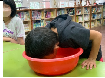
學生挑戰咬蘋果遊戲