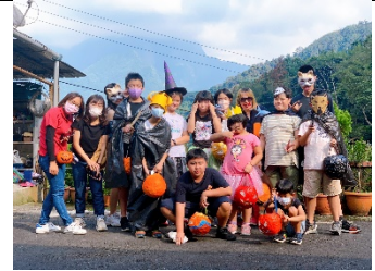
學生家長盛裝打扮參與遊行活動