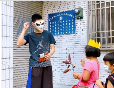
老師於路途中設置關卡1：猜拳獲勝才能獲取糖果