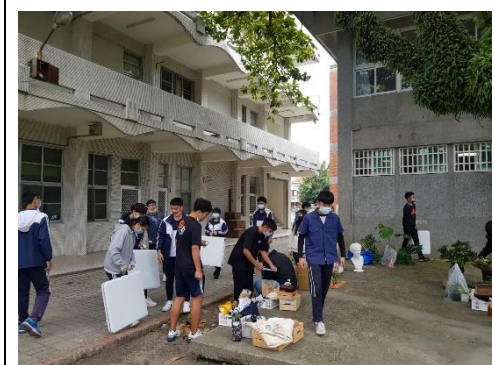
創意潛能開發—展品整備