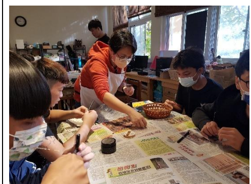
家政領域—指導學生進行工藝創作