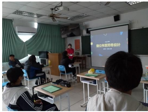
數學領域—問卷設計與製作