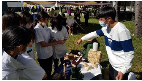
展示佈置 2—學生向觀眾介紹展示成品