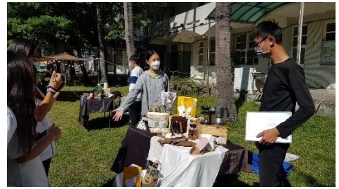
展示佈置 2—學生向觀眾介紹展示成品