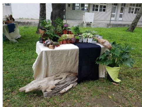
創意潛能開發—展示初體驗