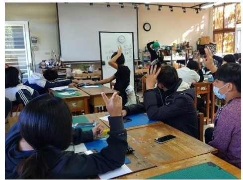
國文領域—文案創意發想