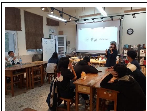
美術領域—對於市集的浪漫想像