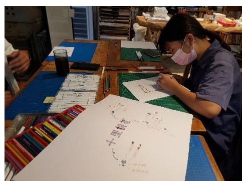
美術領域—學生擬定創意主題