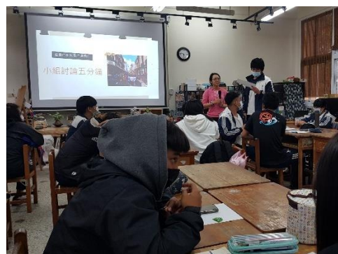
體育領域—音樂與氛圍的營造