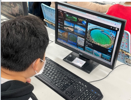
學生利用電腦查找澎湖風景