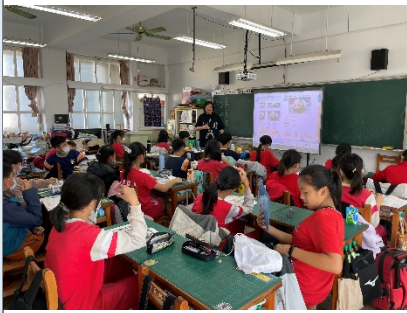
若琪老師指導數學放大與縮小圖