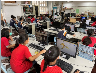
利用志偉老師的資訊課查找需要繪製的主角