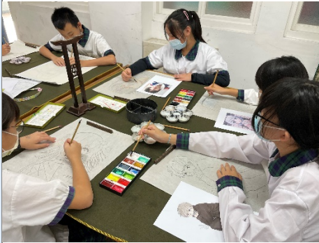
工筆人物作品繪製情形