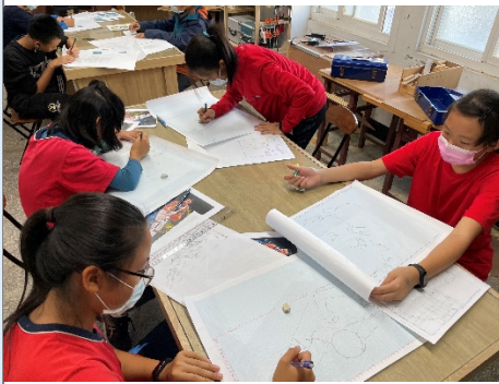
學生放大線稿繪製情形