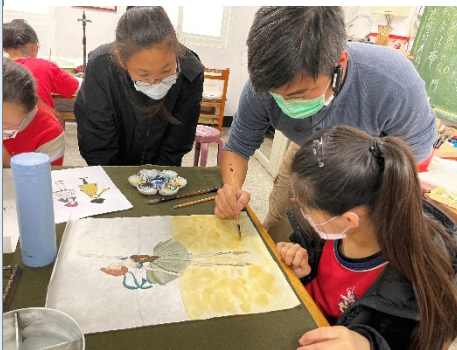
宏翰老師指導學生完成作品