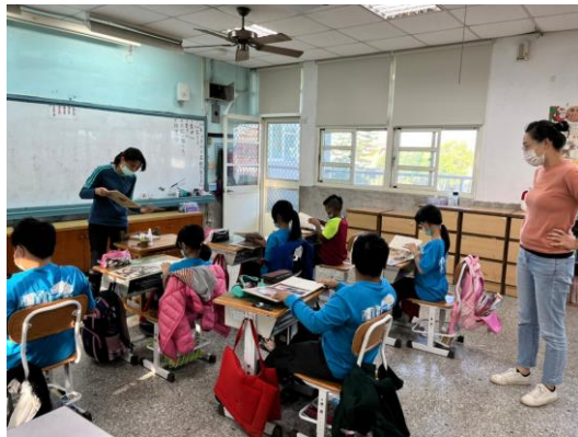
語文領域協同-百步蛇新娘導讀