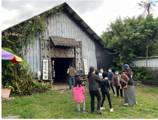
中年級社區踏查-參觀排灣族青年聚會所