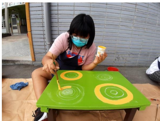
六年級學生專注在桌板上彩繪琉璃珠圖案