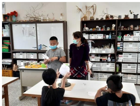
小陶壺課程公開授課-學生介紹自己平面設計圖