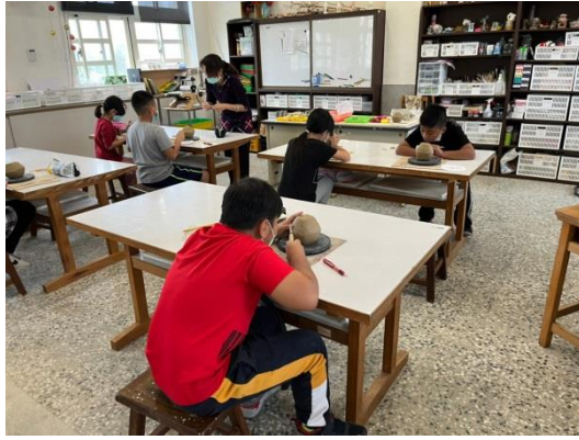
小陶壺課程-從平面到立體陶土創作