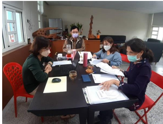
小陶壺課程跨校共備