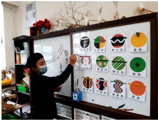
中高年級藝文課程-琉璃珠圖卡設計