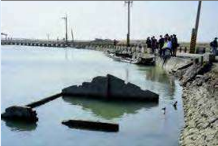
白水湖壽島沒入水中的房子現況可供行走的路面已高於原來屋頂的高度