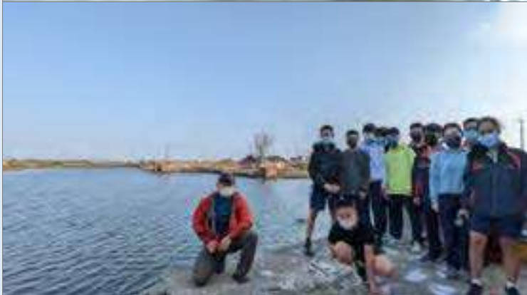
東石的水上屋空無一人的房舍呈現出因地層下陷人去樓空的無奈感