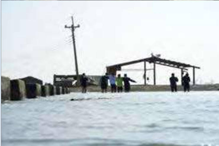
白水湖壽島浸泡在水中的馬路只能依靠旁邊的路緣石來判斷可行走的安全範圍