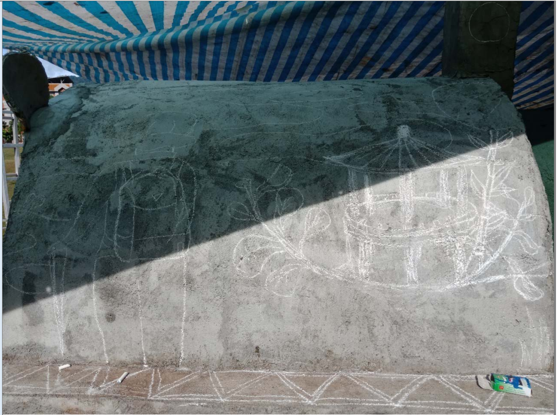
3. 山豬窯彩繪粉筆底圖繪製