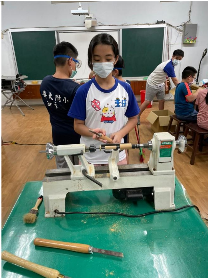
圖五 說明：手工筆課程施作-車刀筆型車削實作。