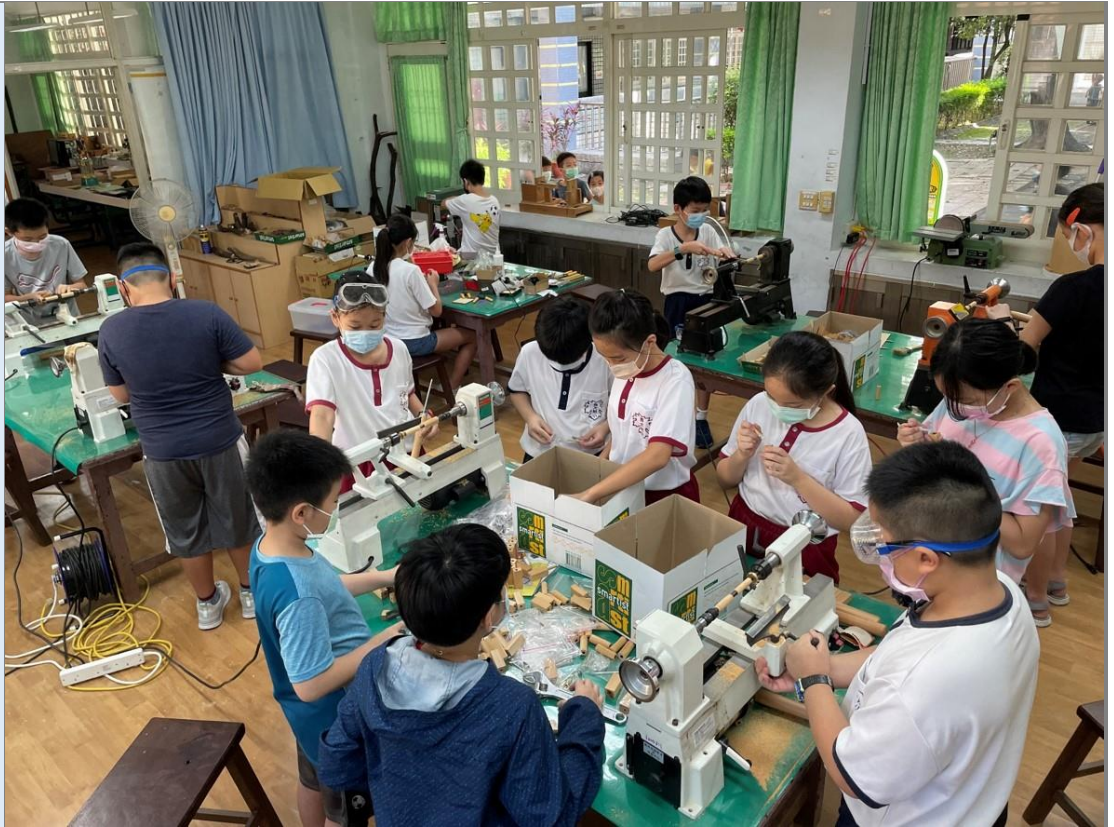
說明：手工筆課程施作-車刀筆型車削實作。