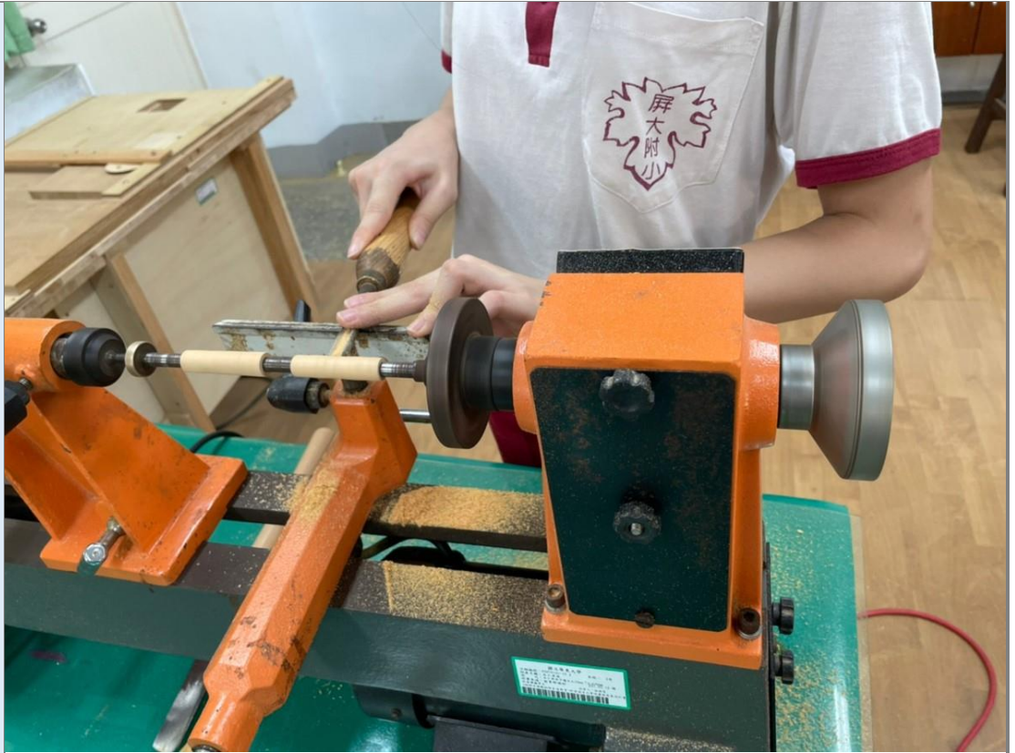
說明：手工筆課程施作-車刀筆型車削實作。