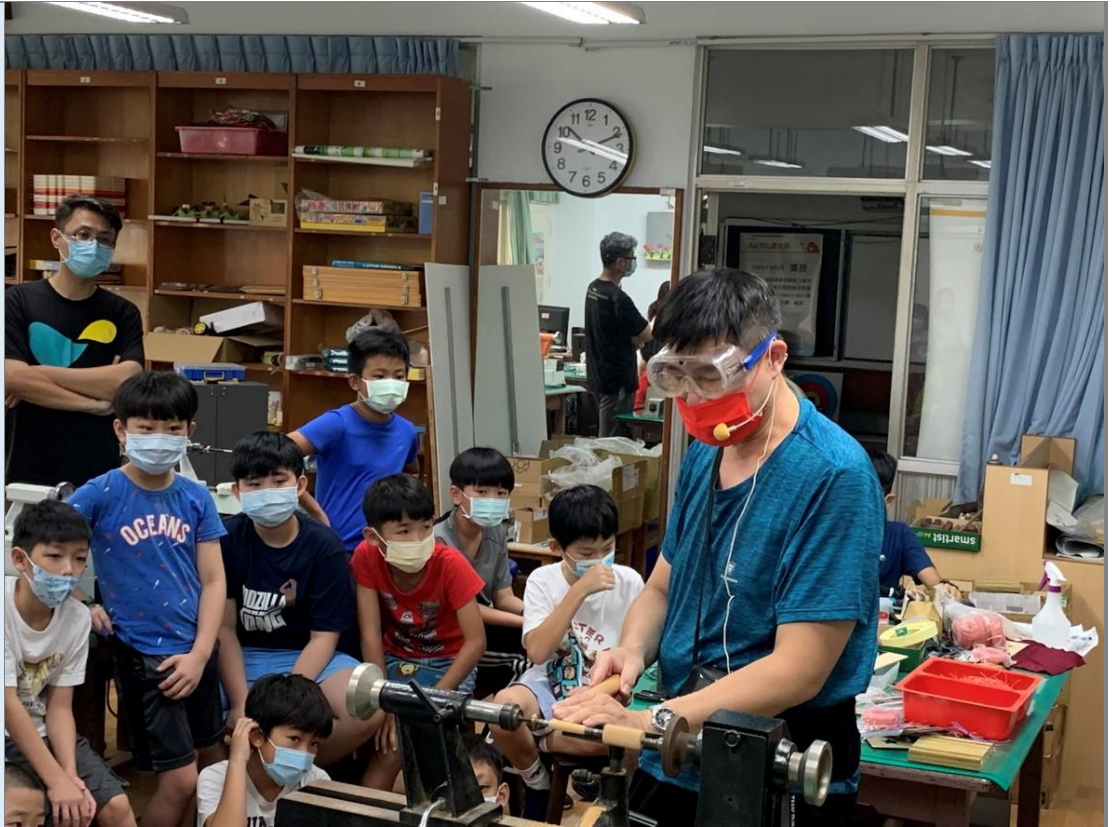
說明：手工筆課程施作-車刀筆型車削教學。