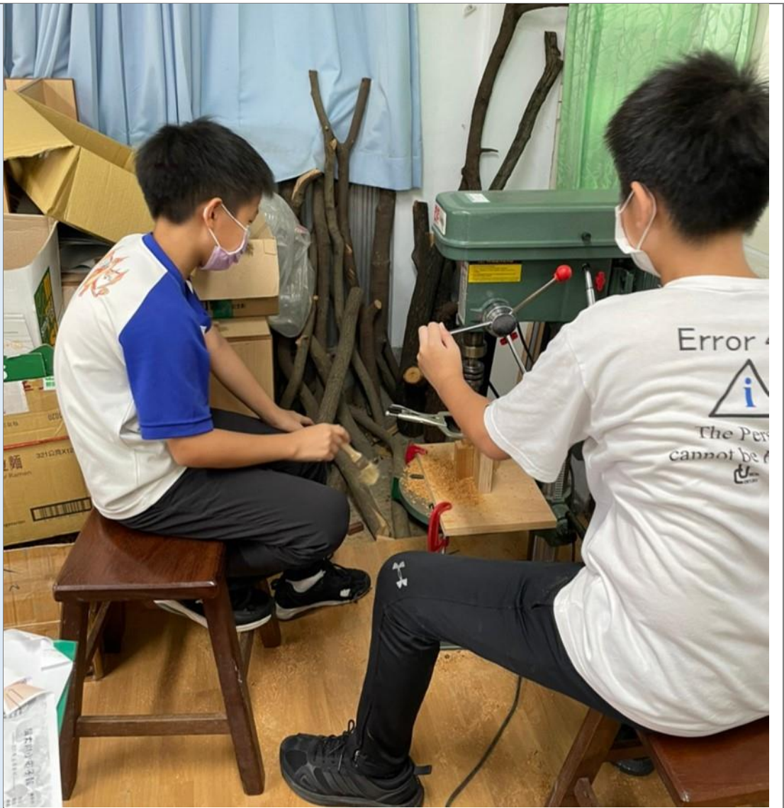
說明：手工筆課程施作-筆身鑽孔實作。