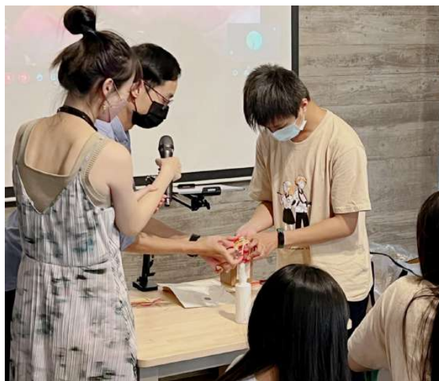
↑將竹編塞至玻璃球內投影示範