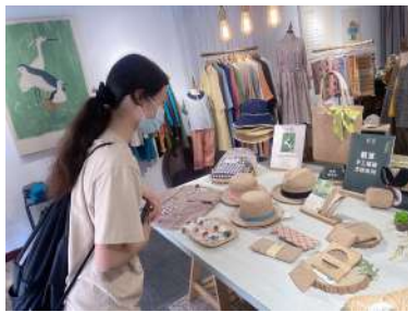
↑竹編工藝店家參觀