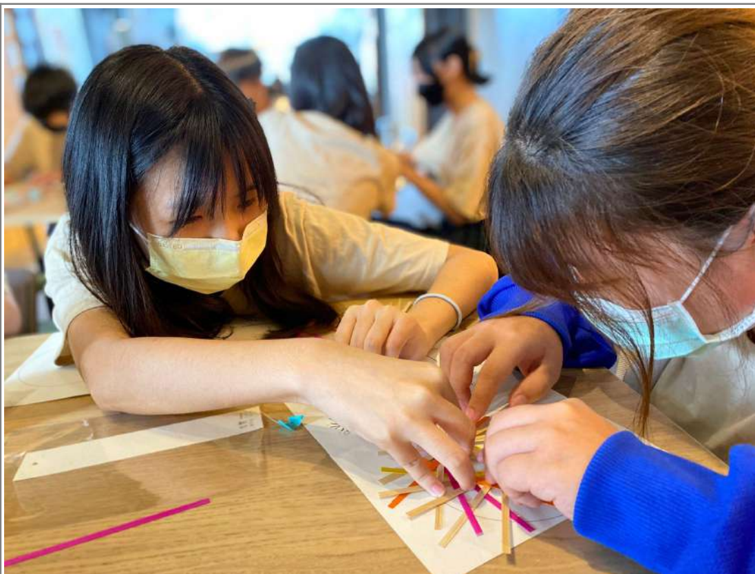
↑挑一壓四口訣，兩兩一組，另一位同學協助不讓竹編位移