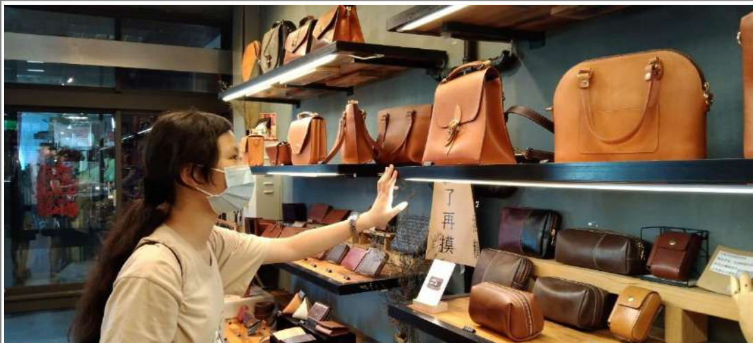
↑傳藝中心商店走訪：DOZI 皮革手作工作室