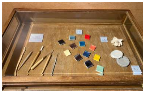
↑ 國寶蟠龍燭臺動畫暨多媒體展，交趾陶材料