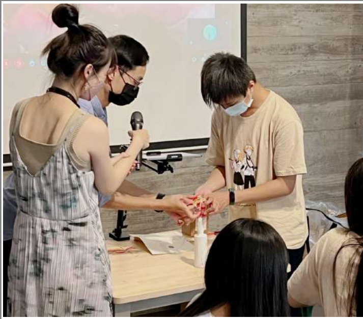
3、綜合活動 成品分享