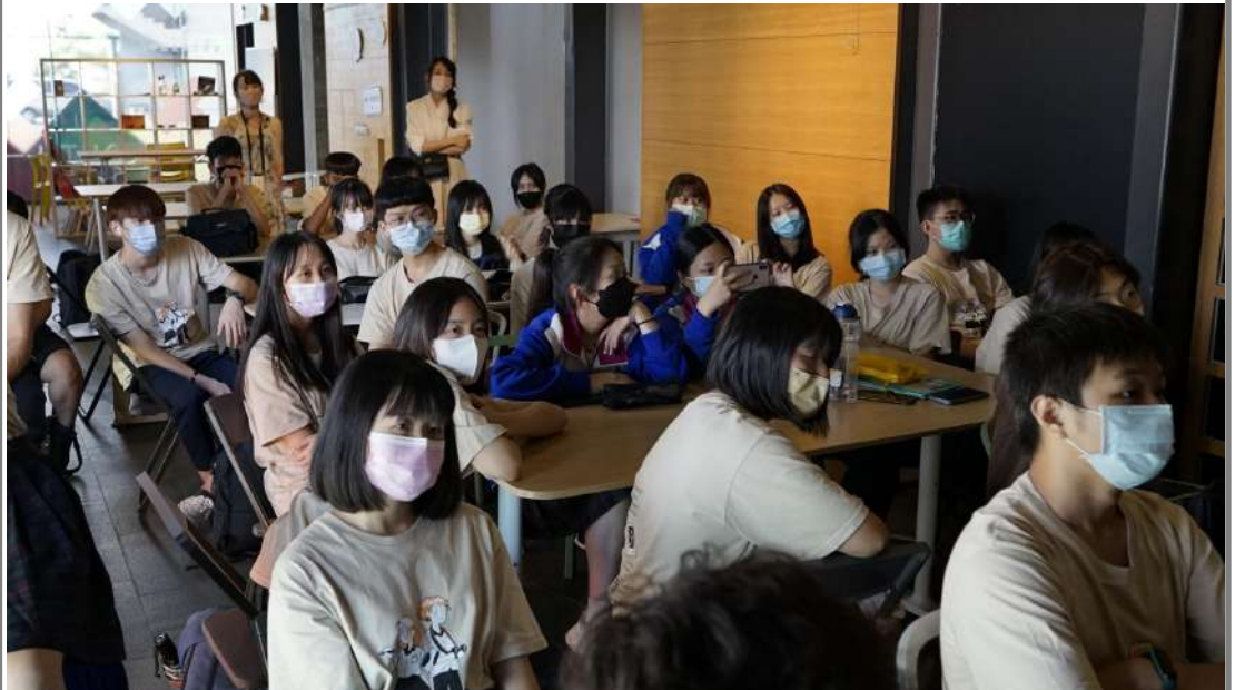
↑宜蘭縣青年交流中心講座區