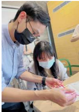
將噴濕的16條竹編環塞至風鈴內