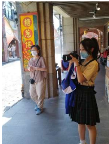
↑ 搜集作業素材攝影