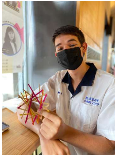
↑外籍交換生竟以第一名速度完成了圓形竹編