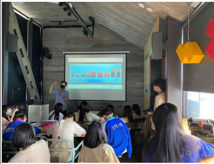
業界竹編教學工作坊推廣

竹編教學 POP ASIA 亞洲手創 | 臺北市教育大學 | 三邊茶院蔦水庫 | 新加坡大學工業設計 | 教育部教室研習