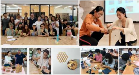
國內外合作及展出案例

竹編教學 POP ASIA 亞洲手創 | 臺北市教育大學 | 三邊茶院蔦水庫 | 新加坡大學工業設計 | 教育部教室研習