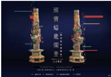
↑國寶蟠龍燭臺動畫暨多媒體展