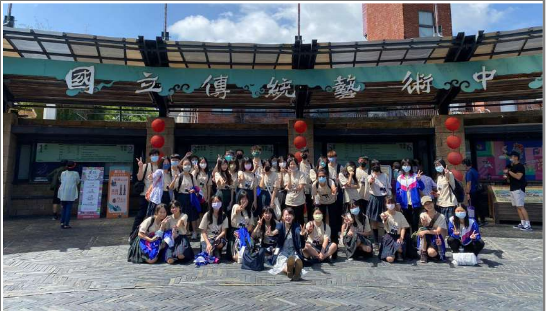
↑傳藝中心大門合影