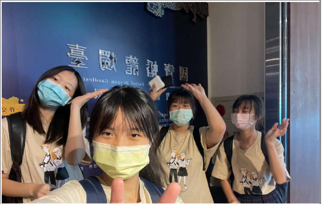
↑ 蠡龍國寶燭台多媒體動畫展