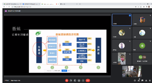
說明香蕉的運銷流程