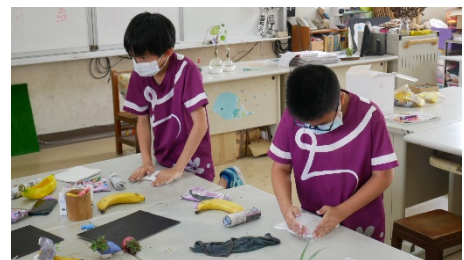
準備捏塑紙粘土香蕉船