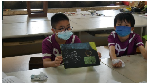
分享歌詞意境的畫面構圖