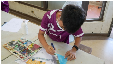
學生進行繪本創作