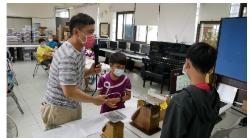
認識香蕉重量與價格