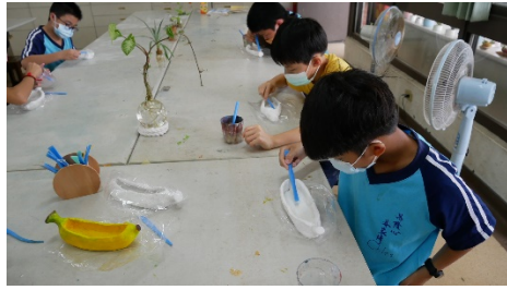
紙黏土香蕉船細部修飾