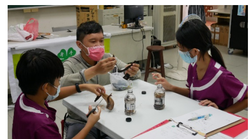
利用香蕉皮製作營養液肥