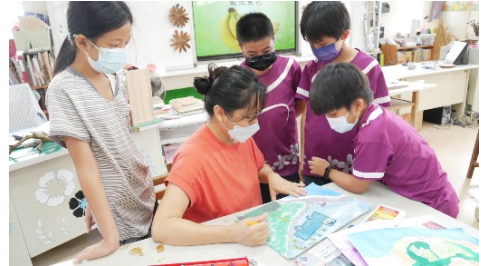
歌曲繪本作品討論