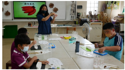
教師說明調色方式