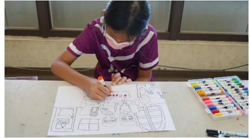
創作以歌寫畫的歌曲繪本