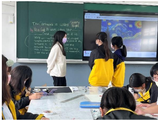
每次上課前 10 分鐘請學生練習用英文介紹作品，期末介紹自己的海報