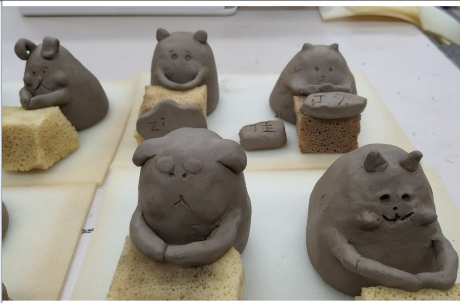
動物公仔創作，呈現每個孩子的童真。