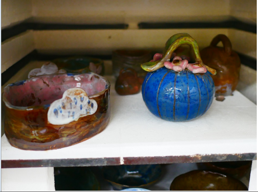
鮮豔的顏色讓陶鈴更加出色。