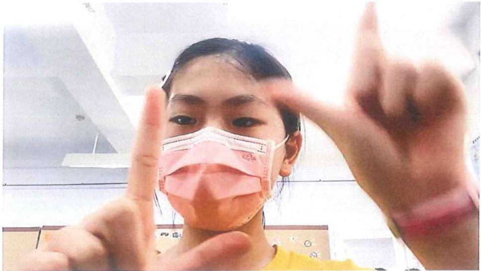
山的手指舞，以平版進行錄影