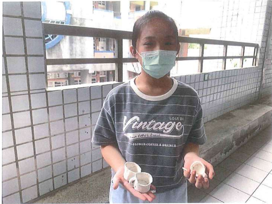
因應疫情無法前往桃博館的班級改在教室手作一手作成品