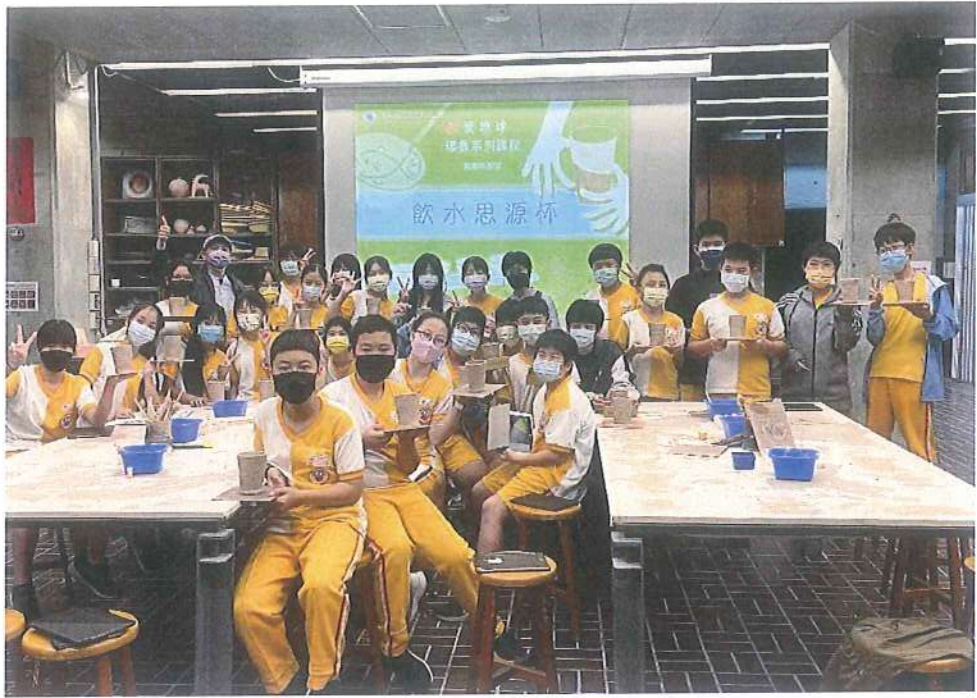
完成飲水思源杯素胚