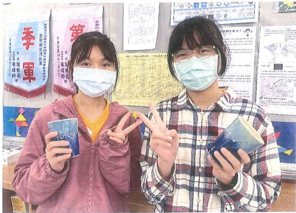
釉燒完成的陶瓷杯作品