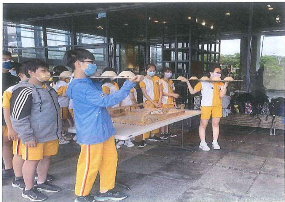
搬陶體驗分組競賽活動