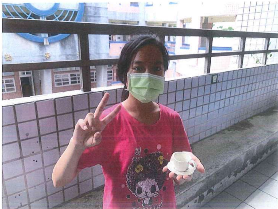
手作成品—咖啡杯組