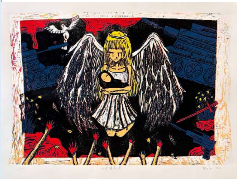
師生評選高分之作品