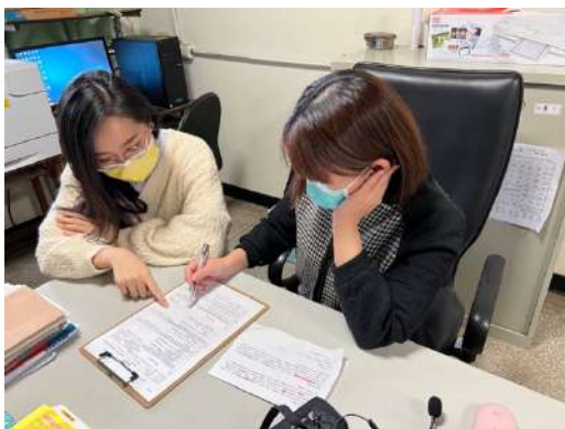
疫情線上上課期間創作理念線上討論 1