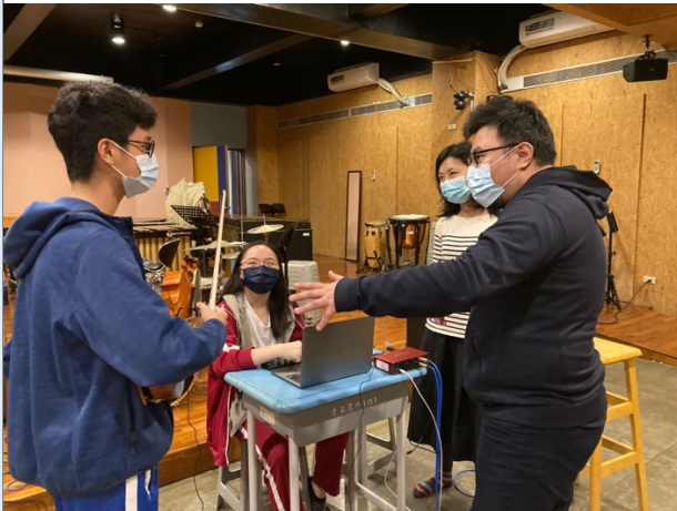
圖八：邀請作曲家蒞校指導電子音樂創作之結構與美學。