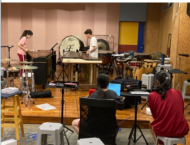
圖九：嘗試以打擊室內樂經典作品為主，輔以電子音樂襯底之再創作。