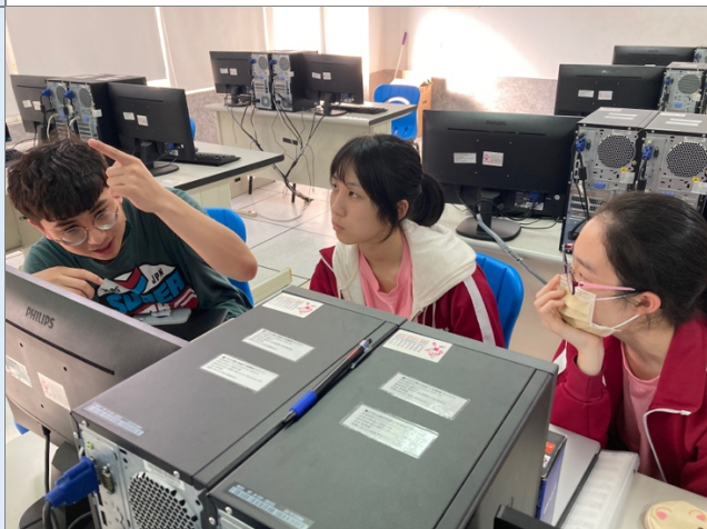
圖一：學生各組分開討論聲音素材與發展

由於疫情嚴峻，原定的校外展演被迫取消，因而改以線上展演的方式。因此，最終我們在電子音樂創作外，還加入了影像，希望能讓聆賞者更能貼近檢視創作者的想像空間。