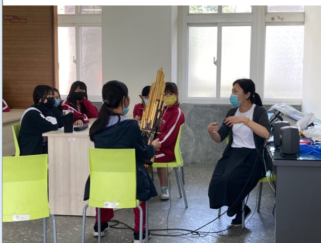
圖三：以笙作為例子，解說如何挖掘樂器的聲音，以及如何帶入 puredata 做聲音的即時形變。