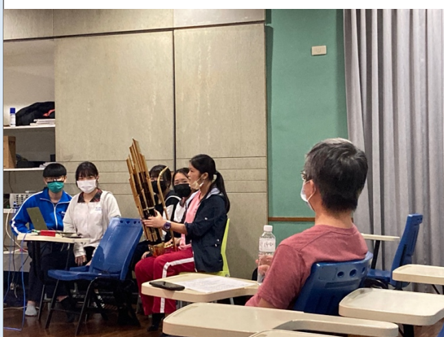
圖五：探討素材在音樂中的實踐，探討具體與抽象的權奪。