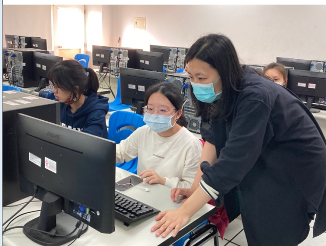
圖二：科技老師指導音訊編成軟體 Pure data