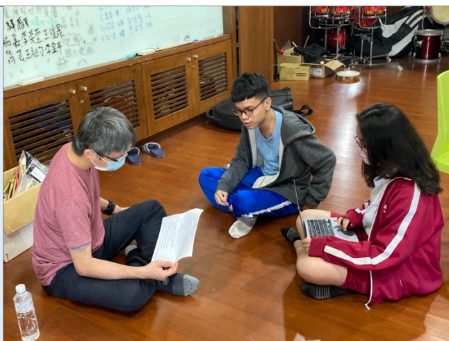
圖四：與作曲家面對面討論聲音素材的發展與結構。