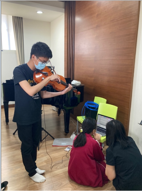
圖七：探索樂器即時錄聲與電音之間的互動性。