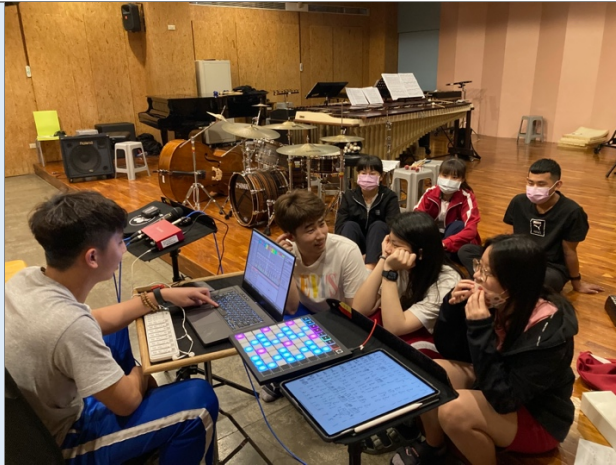
圖十：小組間討論如何以「24 loops」為創作概念做創作。小組以 Launch Pad 作為觸控音訊之媒材，並以音樂劇場形式表演，製造即時聲響，並由電聲處理 loops。