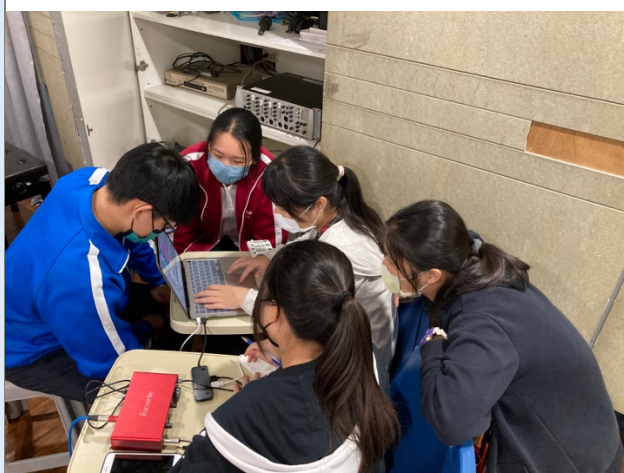
圖六：組員間互相討論、實驗聲音的形變、相容音色的結構處理。