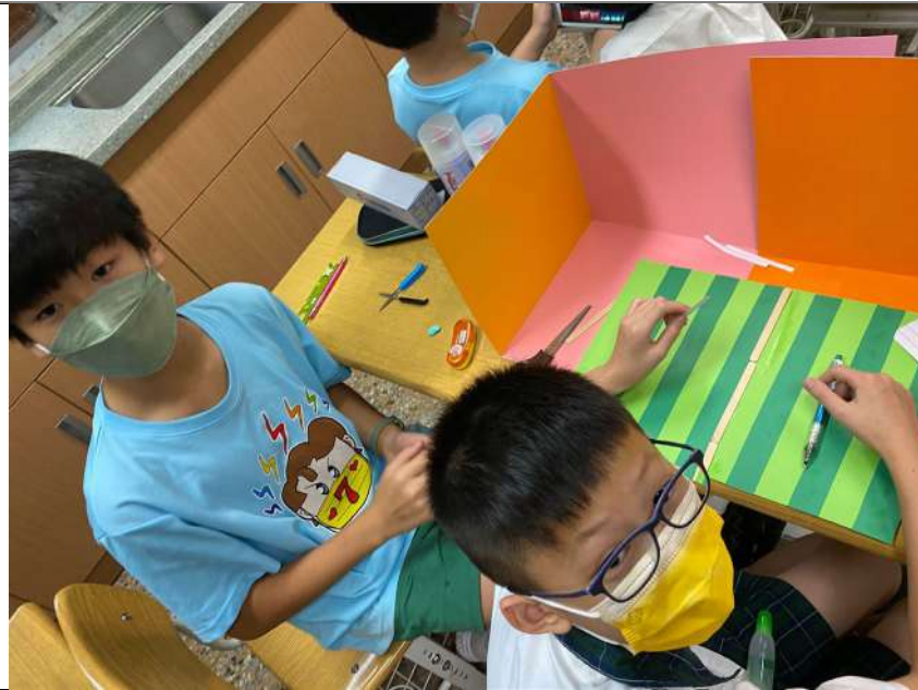
學生製作拍攝 場景