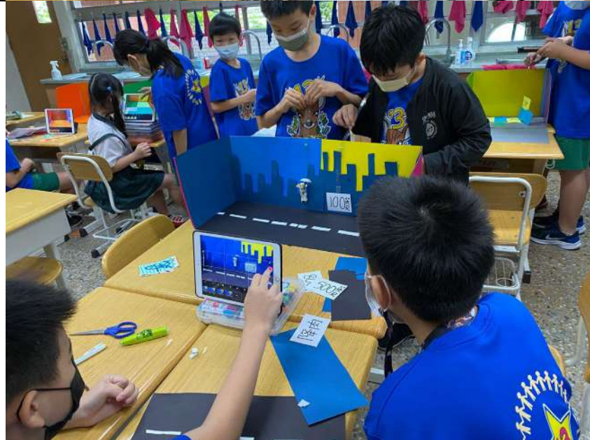
小組合作拍攝 影片