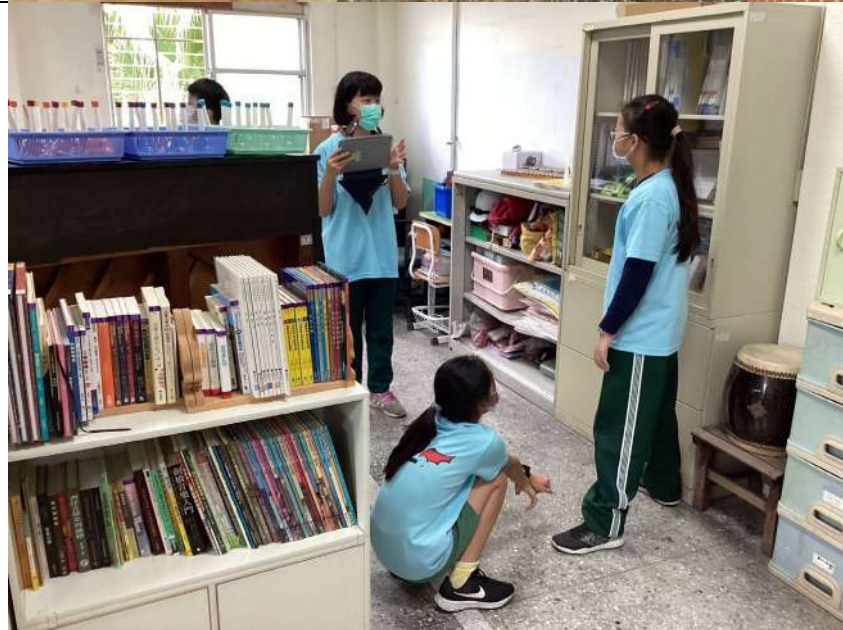
小組於教室內拍攝 MV