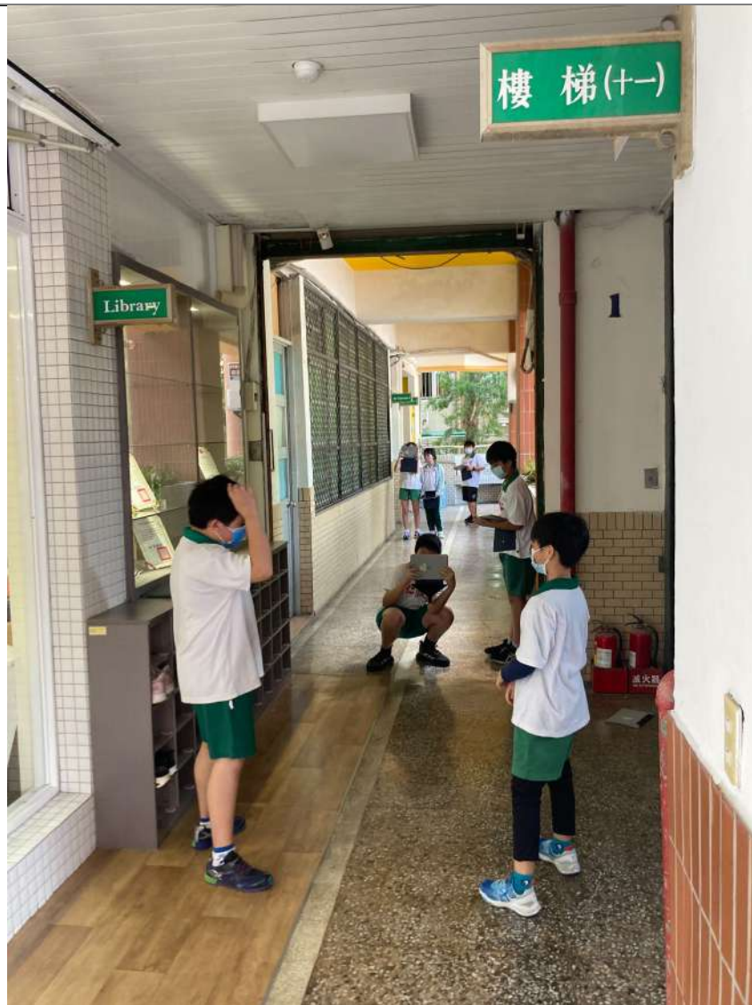
小組至校園取景拍攝 MV