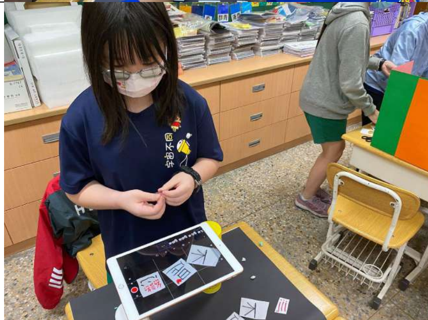
小組成員防疫 在家，學校同 學獨立拍攝。