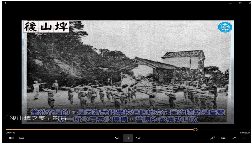
在地後山埤影片創作文史探索：成德國中的前身