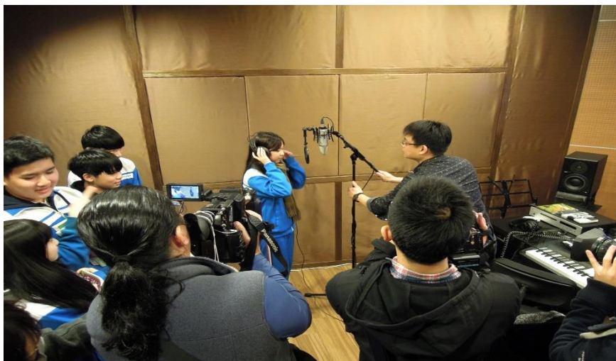
錄音室體驗，透過軟體修改錄音作品