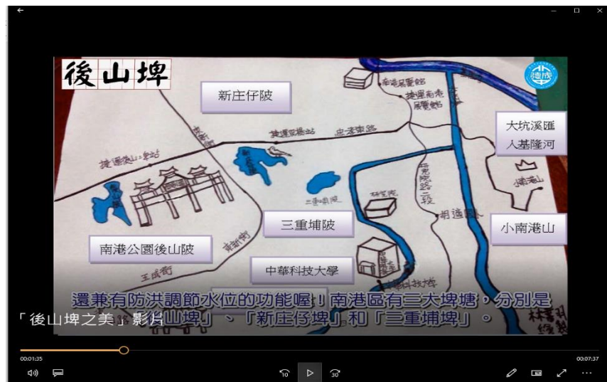
在地後山埤影片創作文史探索：後山埤的前身