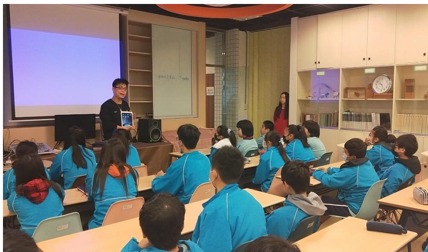
數位音樂課程：軟體簡介