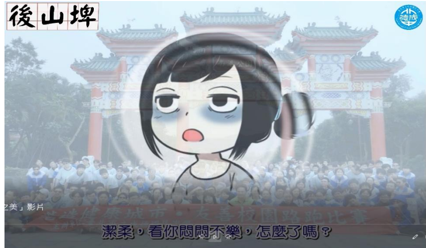
在地後山埤影片創作： 學生蒐集資料、探索討論、編輯錄音的斜槓體驗