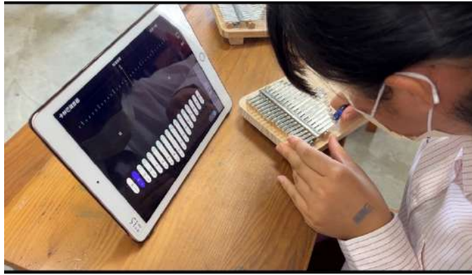
卡林巴琴 調音(用 app)