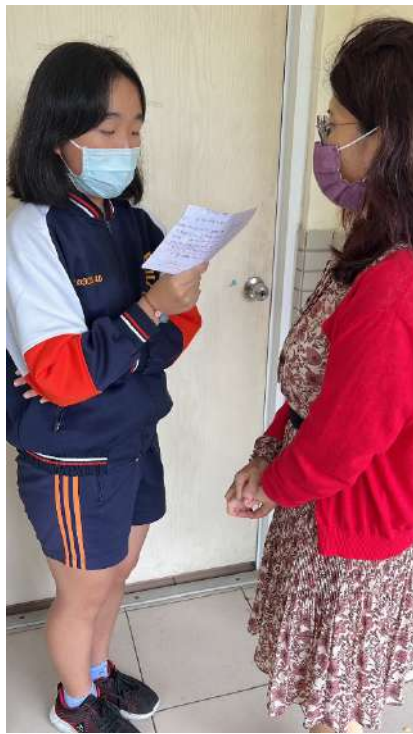
英語老師個別指導學生 如何說出(錄出)給母親的話 1