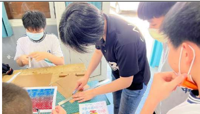
美術老師幫忙裁紙。