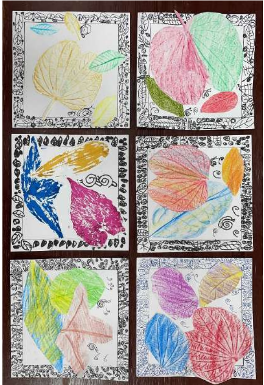
葉脈拓印進行創作，同時了解不同的植物葉脈不盡相同