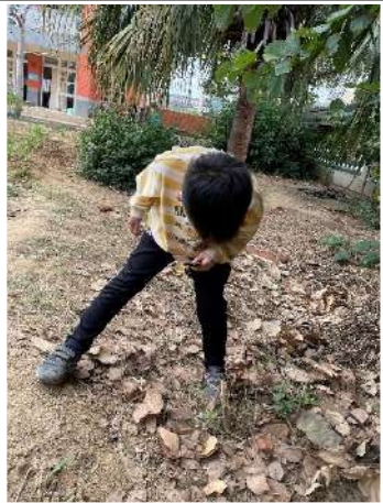
在老師引導下，更深入的校園踏查，認識校園植物 懂綠 -運用雙語教學