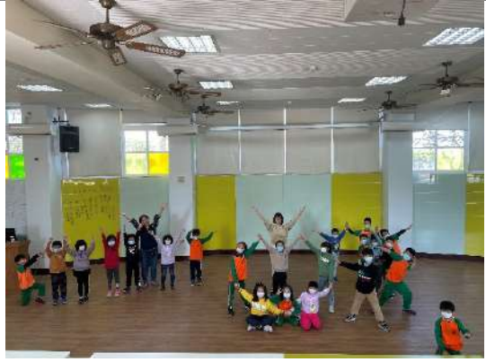
團體創作+導師引導=美麗的舞蹈