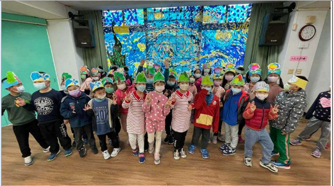
我們要表演「四季」的植物樣態