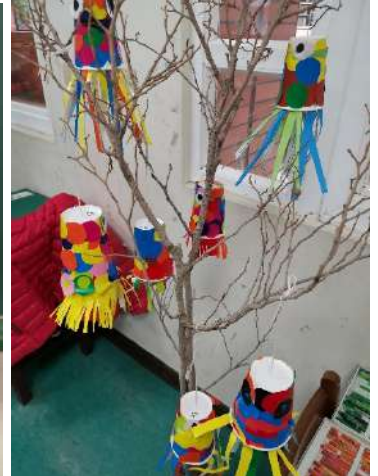
再生-校園枯死的植物玩創意設計