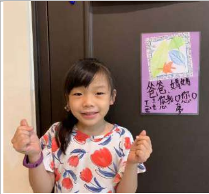
製作感謝卡感謝父母