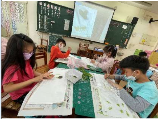
每位學生用心設計安排