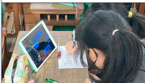
學生學習使用影音製作軟體。