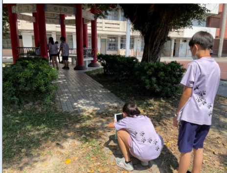
學生在校園內拍攝影像。