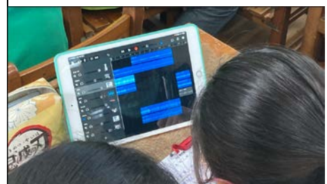
學生學習使用影音製作軟體。