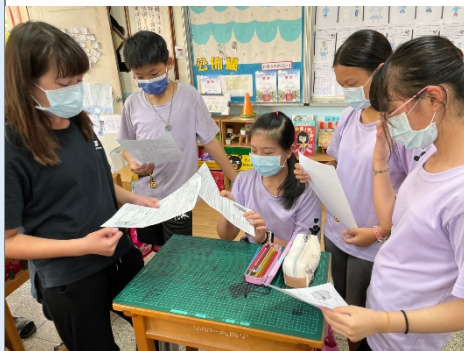
學生分組分享學習單，討論影片內容。