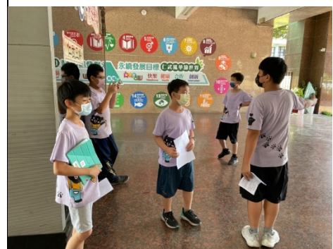
學生在校園內拍攝影像。