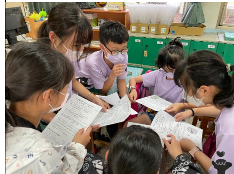
學生分組分享學習單，討論影片內容。