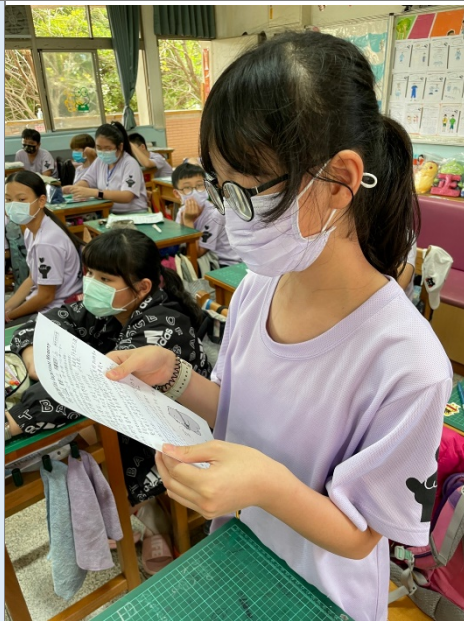
學生完成「校園回憶」，口頭發表。