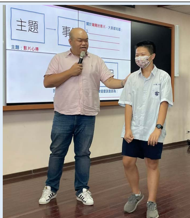
學生上台發表練習

https://drive.google.com/file/d/1iAYivudU5UNZFa0sMLErWJkQwnB7ap4X/view?usp=sharing