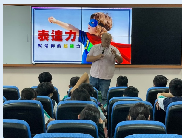
表達力就是你的超能力