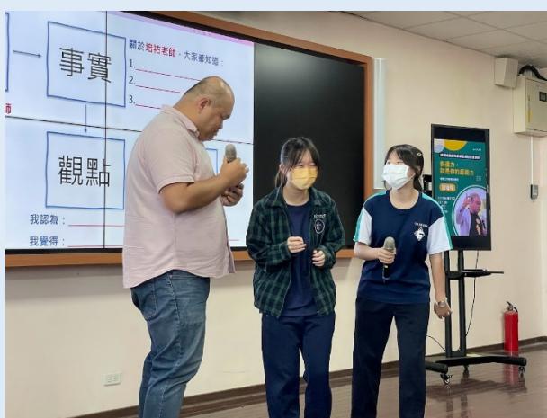
學生上台發表與講師互動