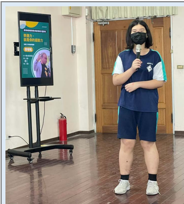
學生上台發表練習