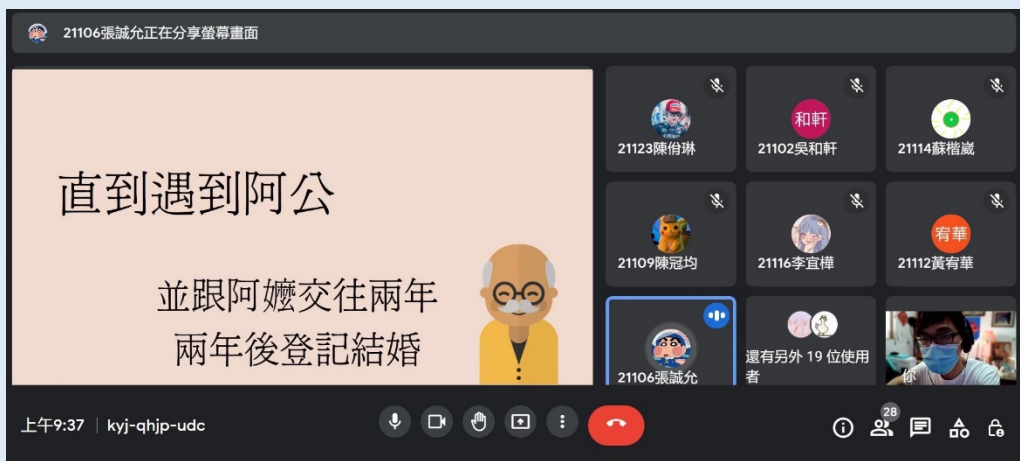
學生線上故事發表