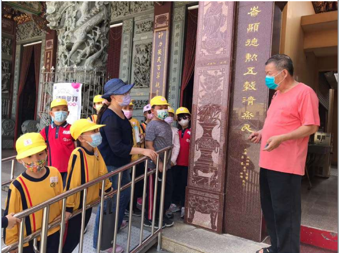
照片四:耆老解說廟宇歷史、祭祀主神、建築特色，並回答小朋友的提問。