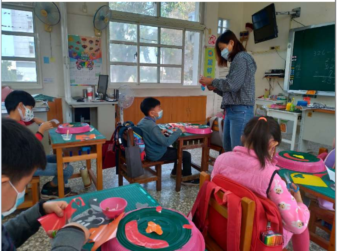
照片十一：創意獅頭面具——用色紙描繪獅子五官、額頭的「王」字、牙齒、腮紅，然後剪下，調整位置後，用白膠貼在塑膠圓盤上。