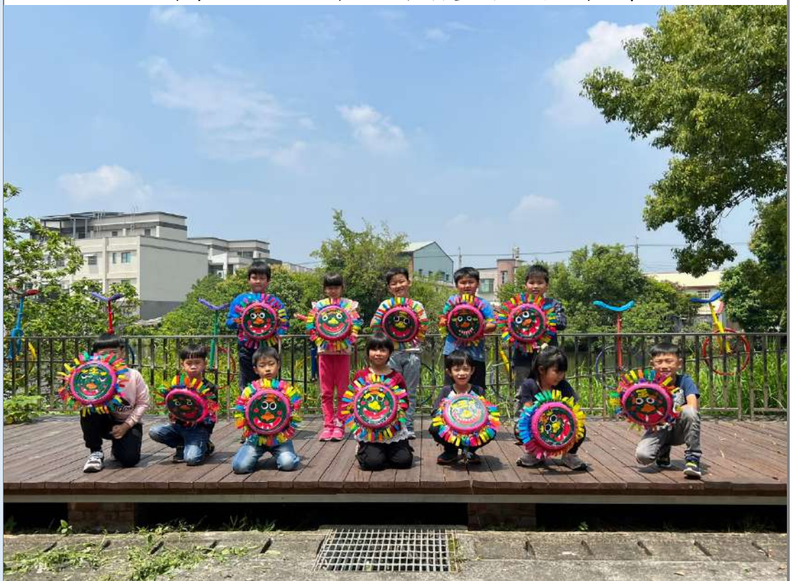
照片十五：獅頭面具完成後，老師帶至空曠處，播放節慶音樂，讓學生隨著音樂的節奏，擺弄獅頭。