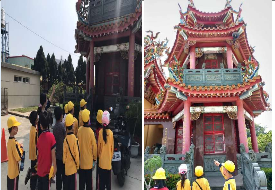
照片八：廟宇建築藝術：鐘樓、鼓樓。學生學習成語「暮鼓晨鐘」的由來。