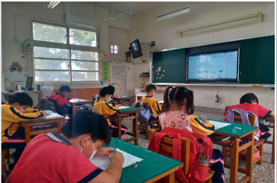
照片九：完成「社區守護神」學習單。