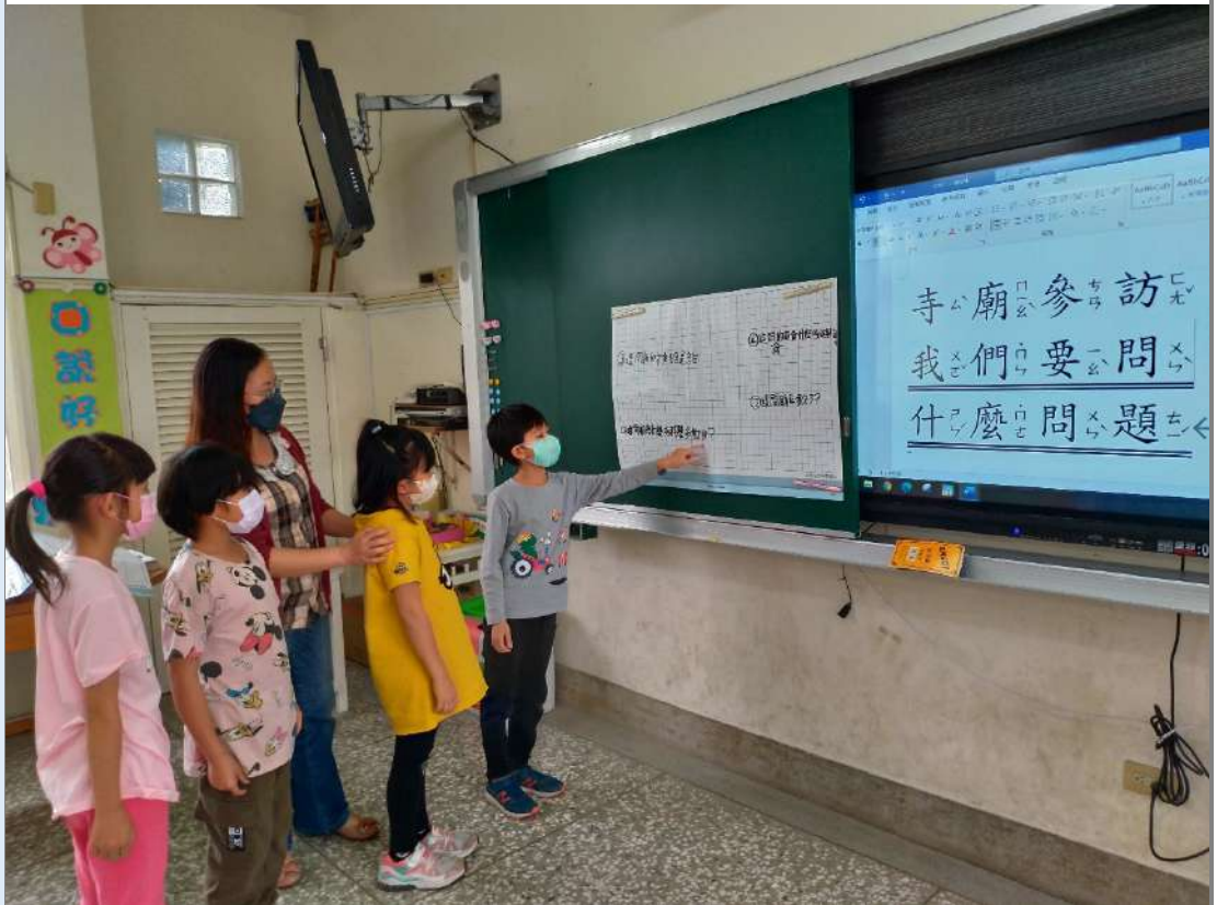
照片二:分組上台發表：到新興宮參訪要問耆老那些問題？