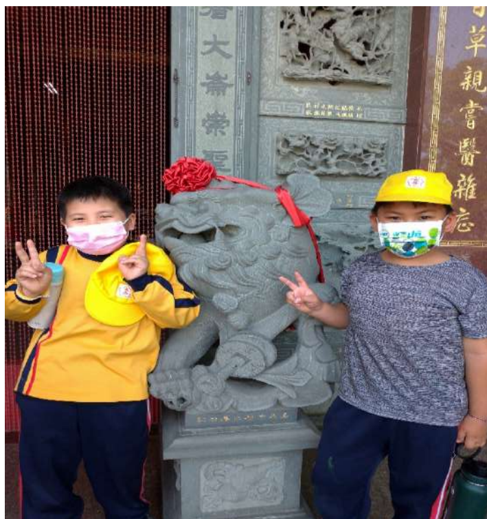
照片五:廟宇建築藝術：石獅。學生學習如何辨別公獅或母獅。