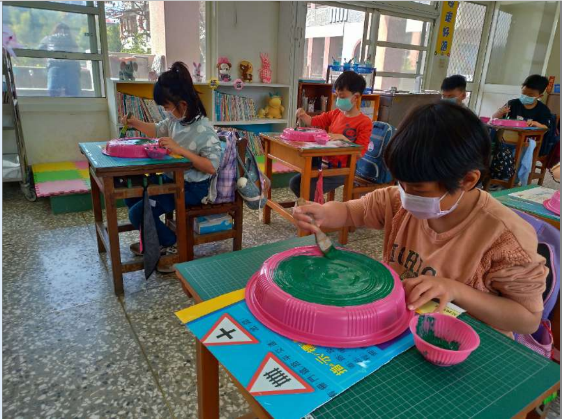
照片十：創意獅頭面具——用壓克力水彩在塑膠圓盤上塗上底色，等候乾燥。