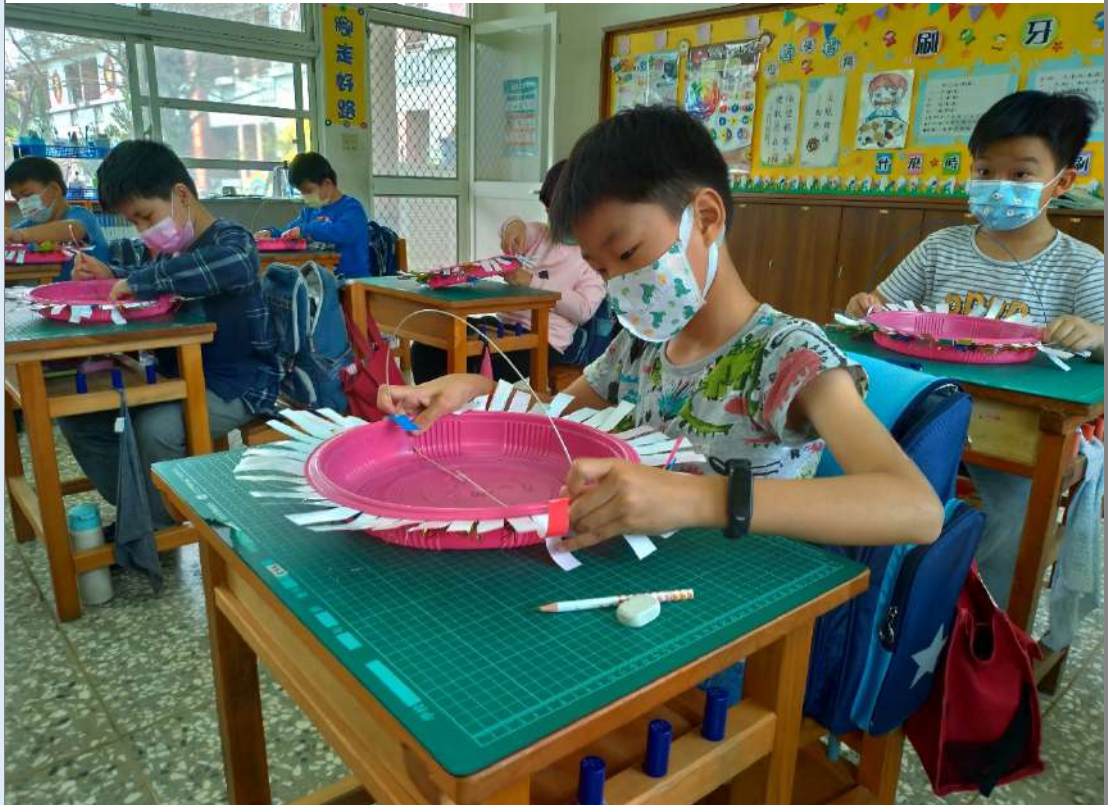
照片十四：創意獅頭面具——老師協助於獅頭面具雙側各穿一洞後，學生自行用鉛線穿過兩個洞，再加上鈴鐺後，小心將鉛線旋緊。