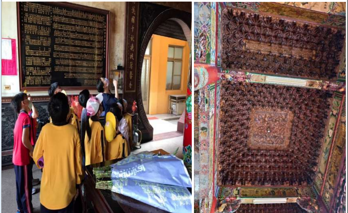
照片七：廟宇建築藝術：藻井(木雕)。