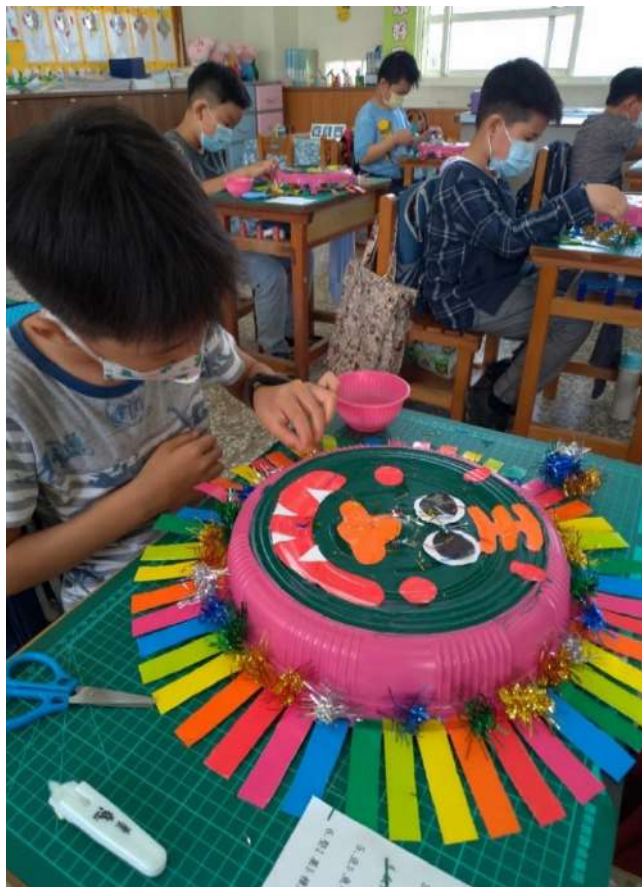
照片十三：創意獅頭面具---用色紙剪下多色的紙條，用白膠黏貼於塑膠圓盤的邊緣，並用金蔥做裝飾。