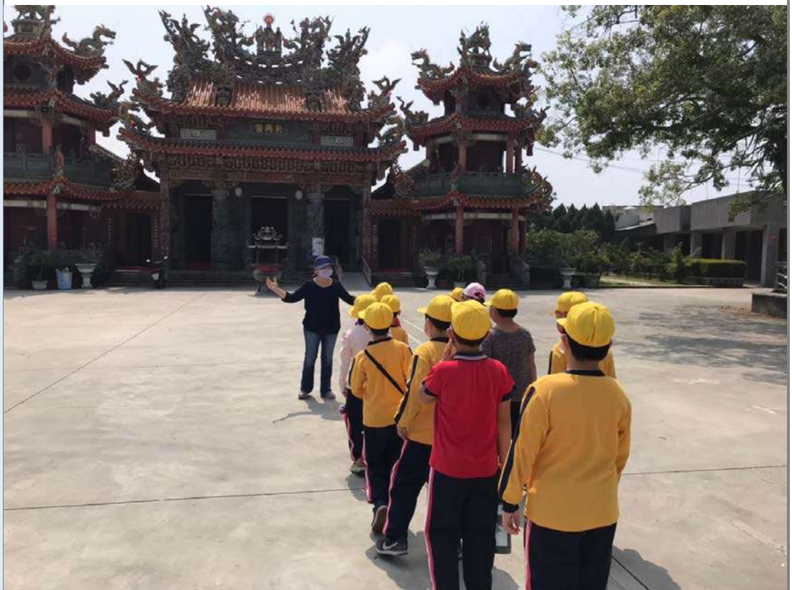
照片三:到新興宮參訪