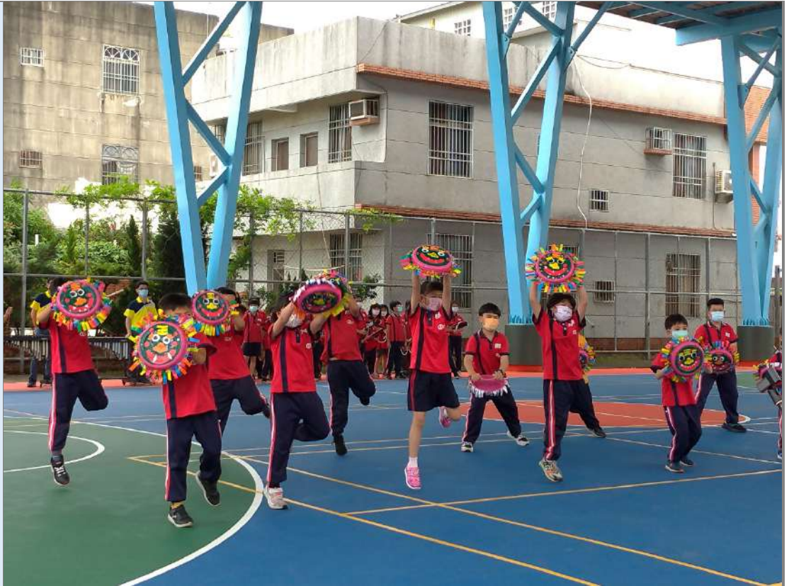
照片十六:延伸活動:在校慶活動中表演「歡喜來弄獅」。