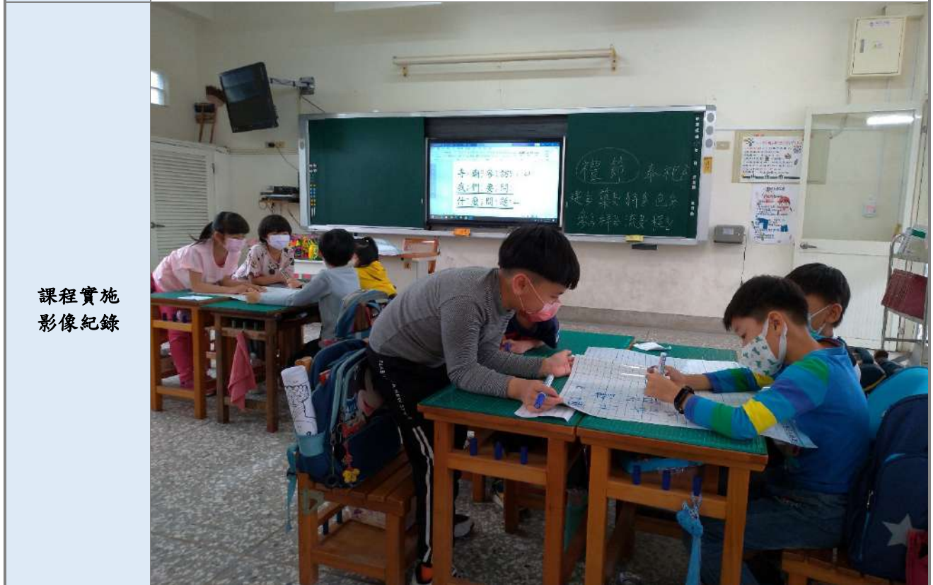
照片一:分組討論:到新興宮參訪要問耆老那些問題?用小白板記錄下來。

推廣與宣傳效益 學生利用獅頭面具創意作品，配合節慶熱鬧音樂，在101週年大崙國小校慶活動中表演「歡喜來弄獅」，帶動現場氣氛，搏得社區民眾和家長們如雷的掌聲。