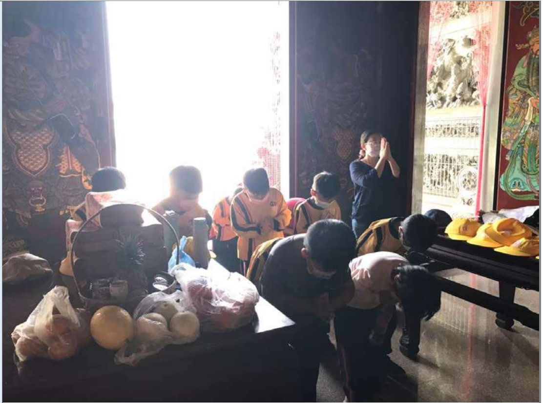
照片六：廟宇參拜禮儀：龍門進，虎口出。還要帶著一顆虔誠的心。