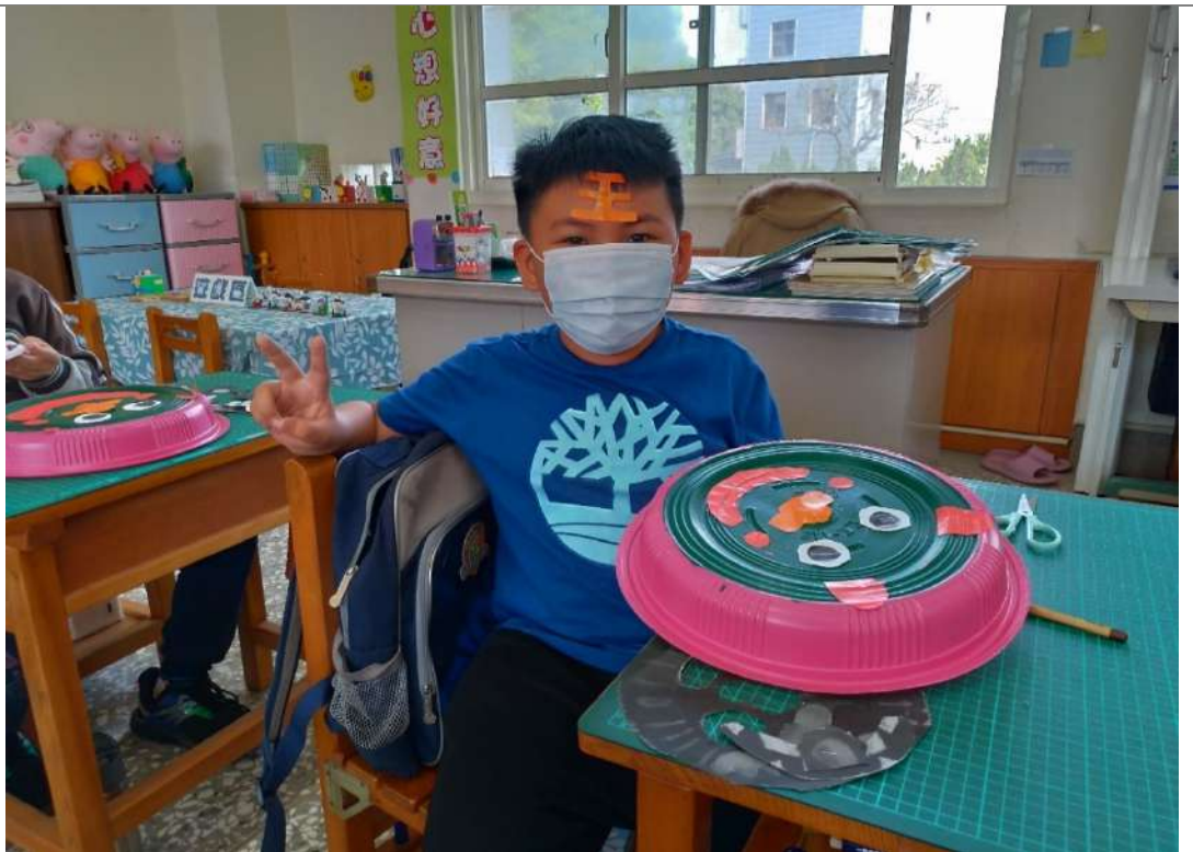
照片十二：創意獅頭面具---用色紙描繪獅子五官、額頭的「王」字、牙齒、腮紅，然後剪下，調整位置後，用白膠貼在塑膠圓盤上。