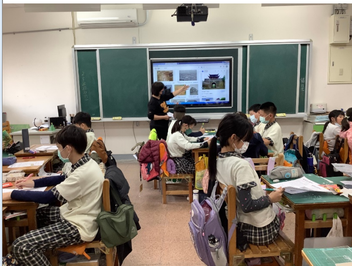
學習單中沒有杭州城的照片，所以老師給大家看現在(2008年重建)的杭州城城門。