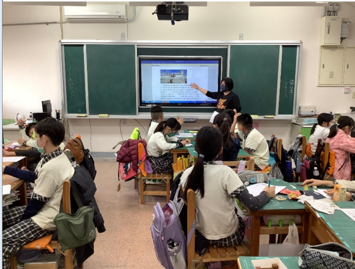
給大家看玉門關的復原圖。