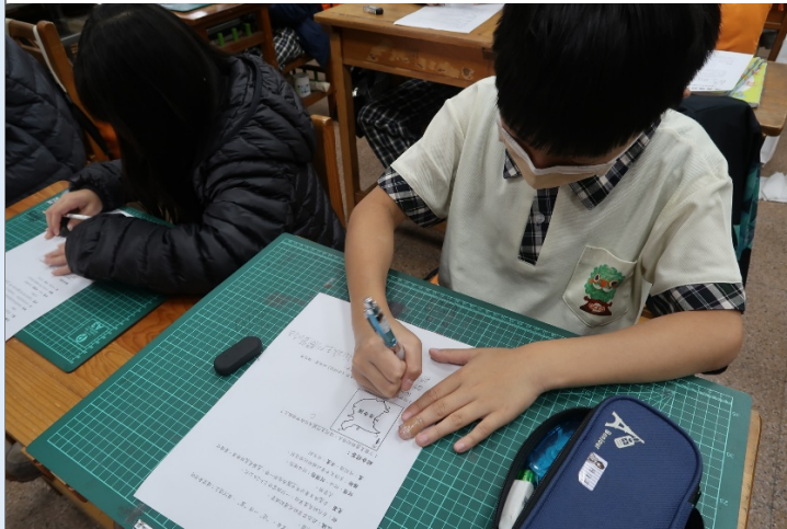
讓學生根據學習單的介紹文去判斷玉門關的可能位置。