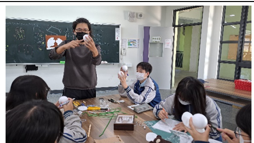
製偶師指導學生製作頭部操縱桿