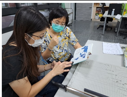
表藝與視藝教師以《黃金、薯條、巧克力：世界原住民奇幻冒險》書籍內容為本，討論適合學生呈現的不同國家原住民族群