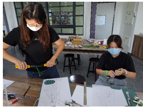
教師依設計稿完成身體支架