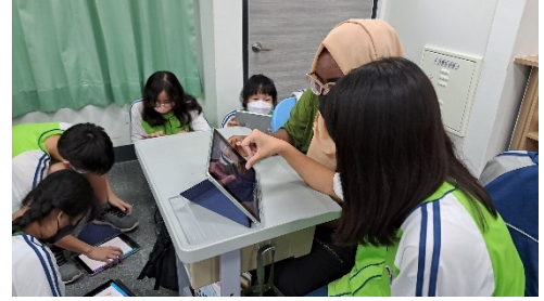
我與世界彈課-搜尋所選擇國家之節慶相關資料，外籍助理協助英文