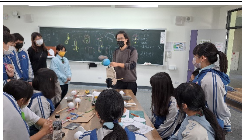
製偶師以自製偶說明執頭偶頭部與