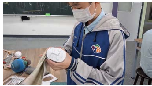
視藝課-學生利用報紙黏貼出頭型