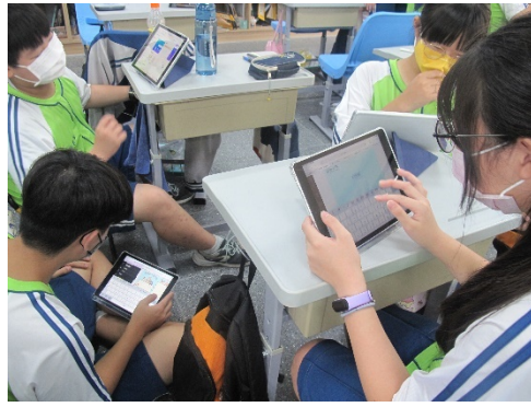
我與世界彈課-小組分工搜尋所選擇國家之相關資料進行 Canva 共編