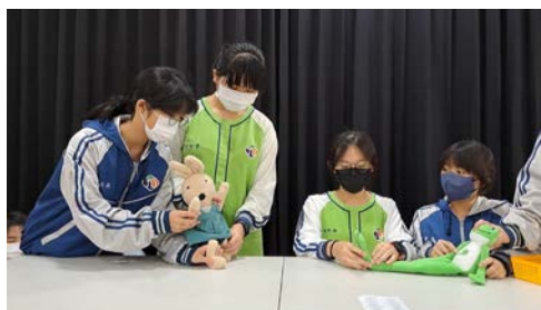
表藝課-小組以童話故事小紅帽劇本片段練習操偶、配音及角色互動