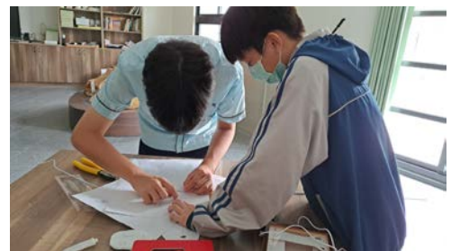
視藝課-學生使用衣架製作執頭偶支架