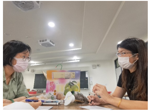
表藝與視藝教師討論學生執頭偶製作進度與材料需求