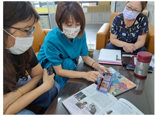
家政教師說明服裝設計原民圖騰