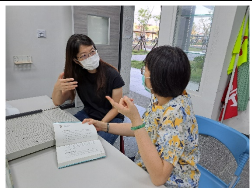
表藝教師分享自己讀後的創意思象