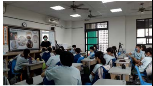
表藝課-介紹各種操偶類型