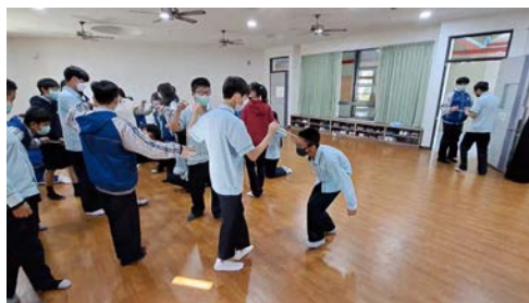
表藝課-小組成員以不同水平共持木棍走動，培養組員默契