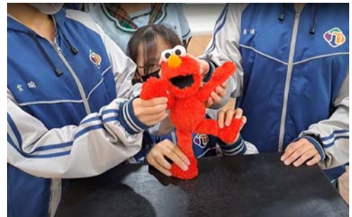
表藝課-三人共操布偶練習操偶技巧、嘗試不同肢體動作並培養默契