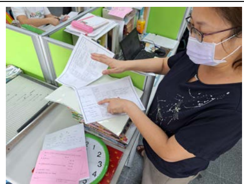
表藝教師瞭解英語外籍助理入班後彈性課程教學內容與進度規劃