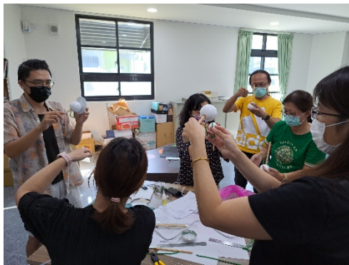
頭部操縱桿位置說明