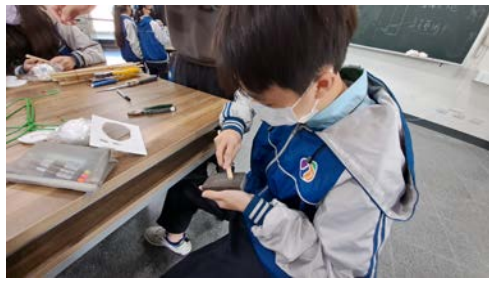
視藝課-學生將操縱桿表面磨平滑