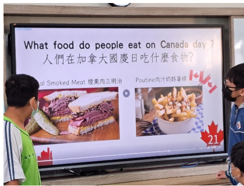
我與世界彈課-節慶主題小組報告