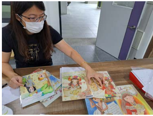
視藝教師以過往指導學生語花一頁書主題作品說明原住民服裝特色