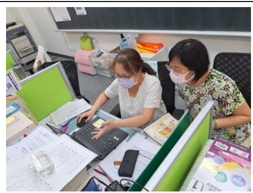
表藝教師與英語教師討論確認彈性課程教學內容與進度規劃