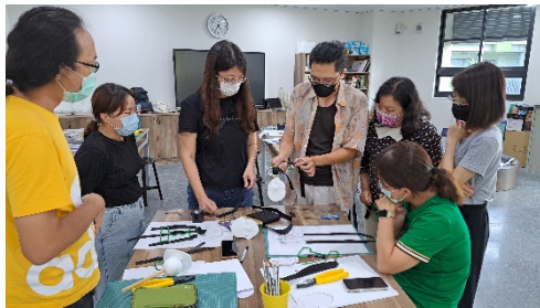
製偶師說明執頭偶支架製作