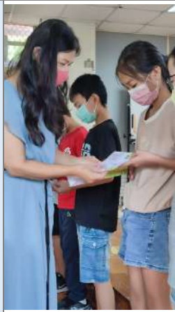
▲校長頒發給學生任務信