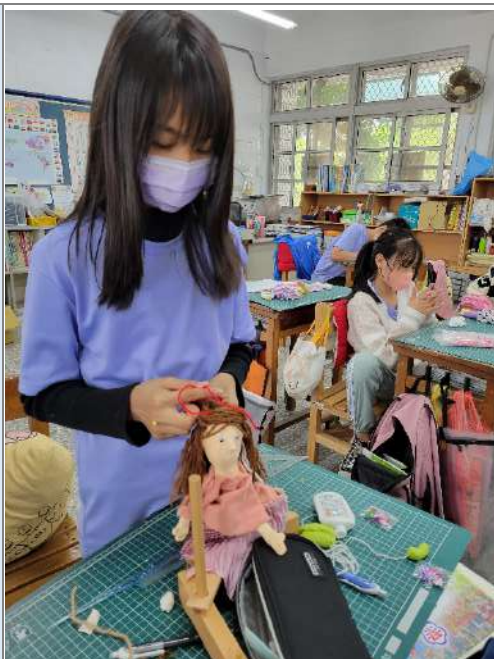
▲學生製作布袋戲偶