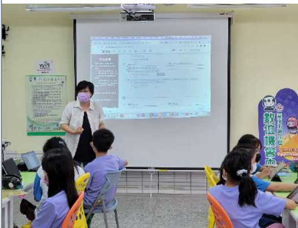
▲劇本編寫搭配思多利寫作課程