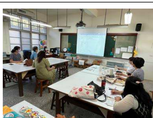
說明：跨領域美感課程內容討論設計