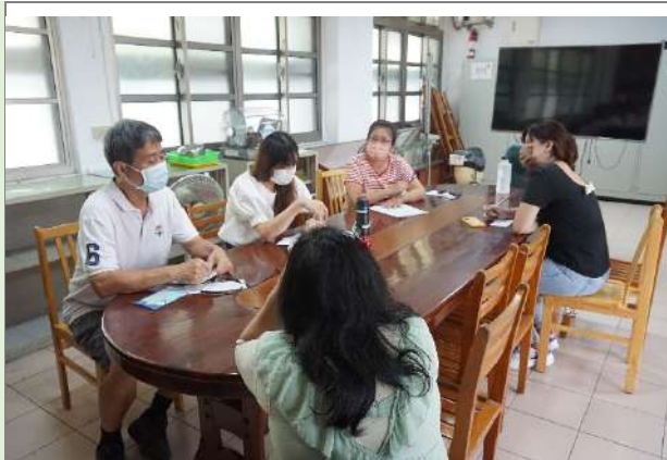
▲成員針對學習單討論。