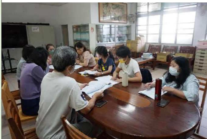
▲成員觀看教案進行討論。