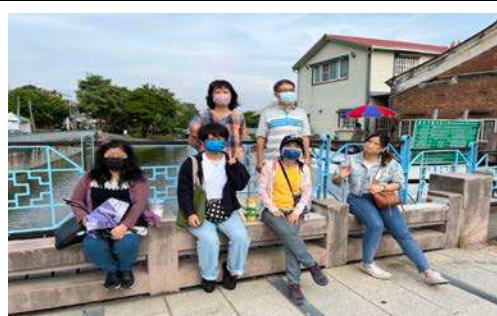
說明：親水公園踏查

111年11月23日/親水公園踏查-討論如何發展親水公園跨領域校訂課程/10人/1校