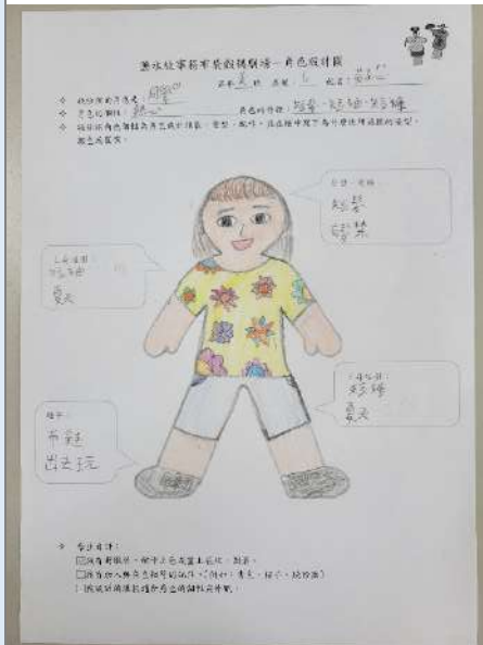
▲角色設計圖學習單