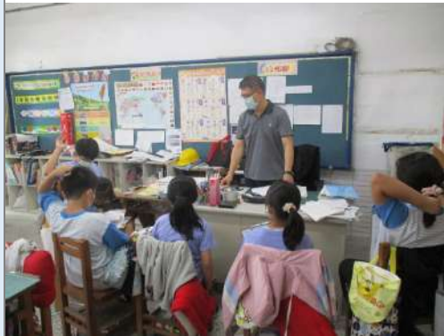
▲每組由一個老師引導，討論訪談問題