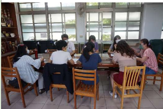
▲成員對於教案內容提問。