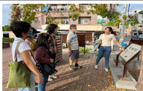
說明：水質淨化場的功能及作用