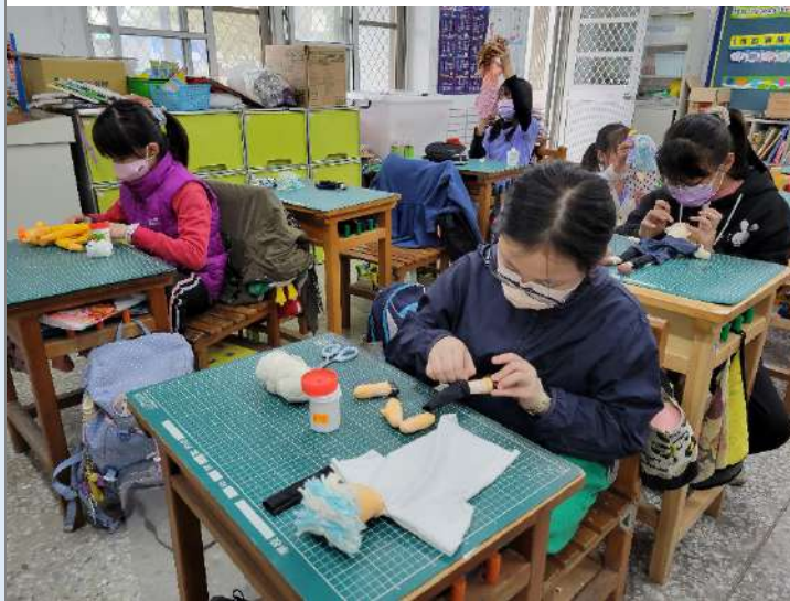
▲學生製作布袋戲偶