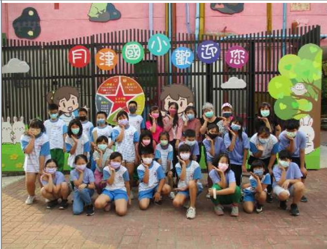
▲訪談長者後的大合照