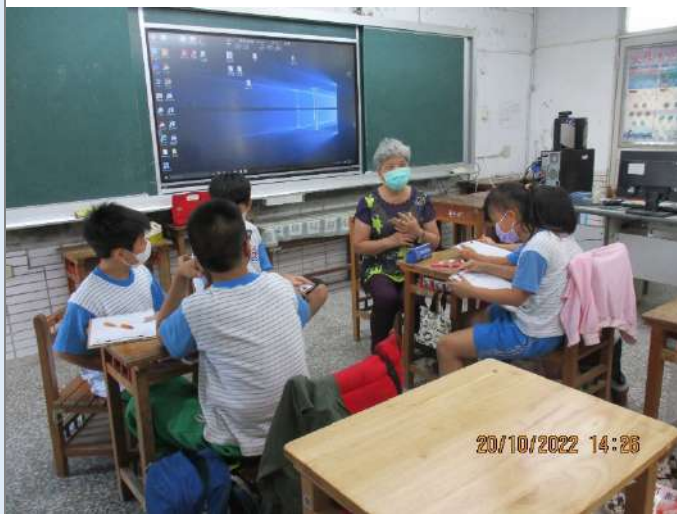
▲分組訪談長者的過程