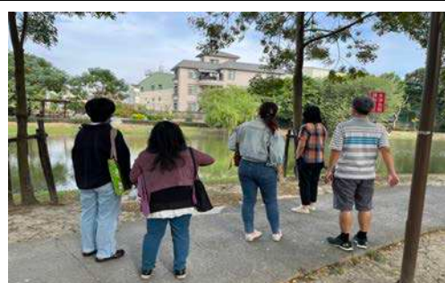
說明：課程內容問題討論