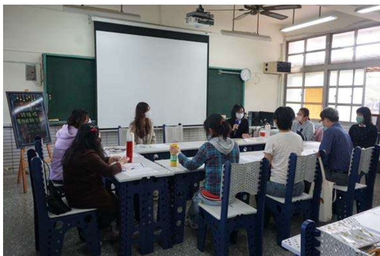
▲請高師大教授到校指導。