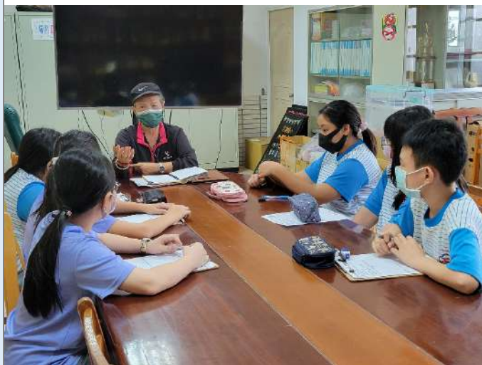
▲分組訪談長者的過程