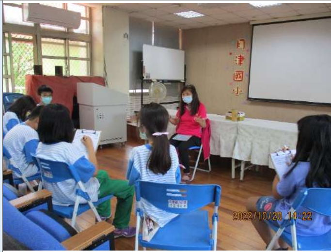
▲分組訪談長者的過程