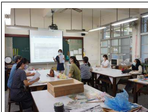
說明：跨領域活動分析

1.日期：111年8月26日、111年8月29日/跨領域美感計畫課程內容討論/10人/1校