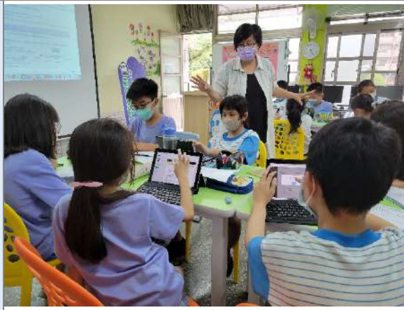
▲劇本編寫搭配思多利寫作課程-講師解說中