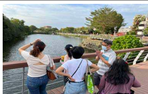
說明：課程內容問題討論