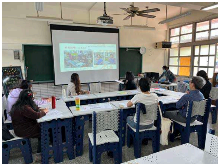
▲ 社群教師向教授說明目前跨領域美感課程實施概況。