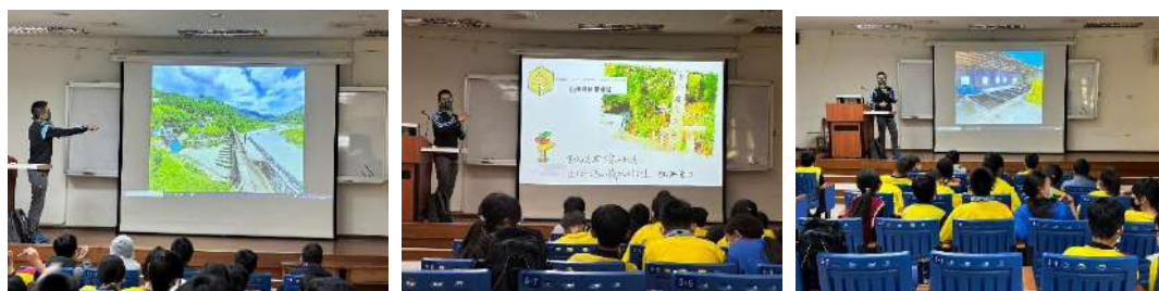
老師介紹台江烏山嶺水利古道

(照片至少 6 張加說明，每張 1920*1080 像素以上，並另提供原始 jpg 檔)