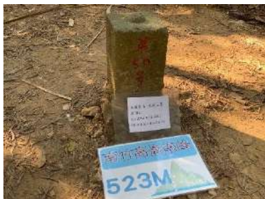
曾文水庫水庫水庫