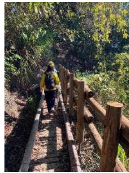
這段有點辛苦有點害怕!