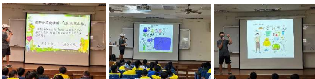
老師講解登山相關注意事項