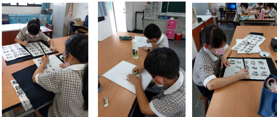
練習書寫西遊記的角色名字