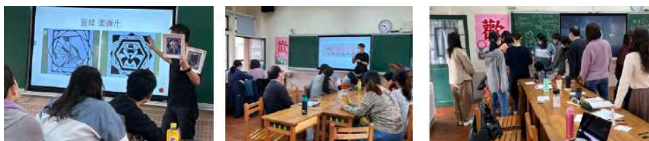
圖說：鼓勵參與計畫的夥伴分享108、109、110的跨領域美感課程。持續耕耘也成功將跨領域美感教育的種子在北小校園擴散開來。