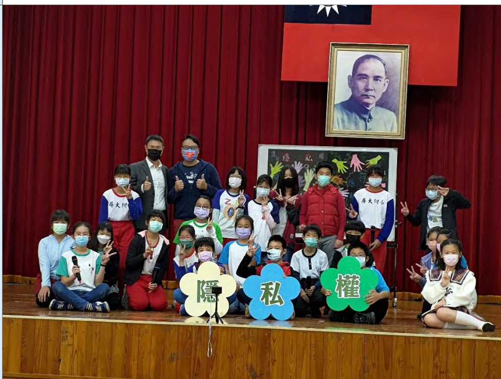
說明：戲劇展演~謝幕