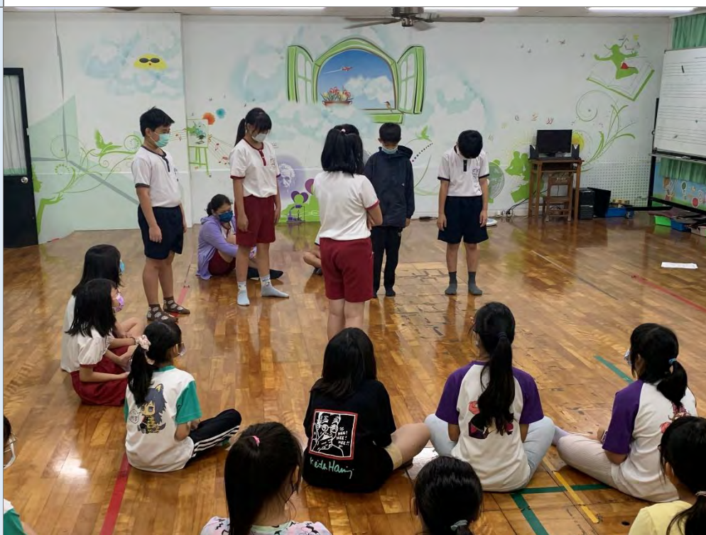
說明：展演技巧練習