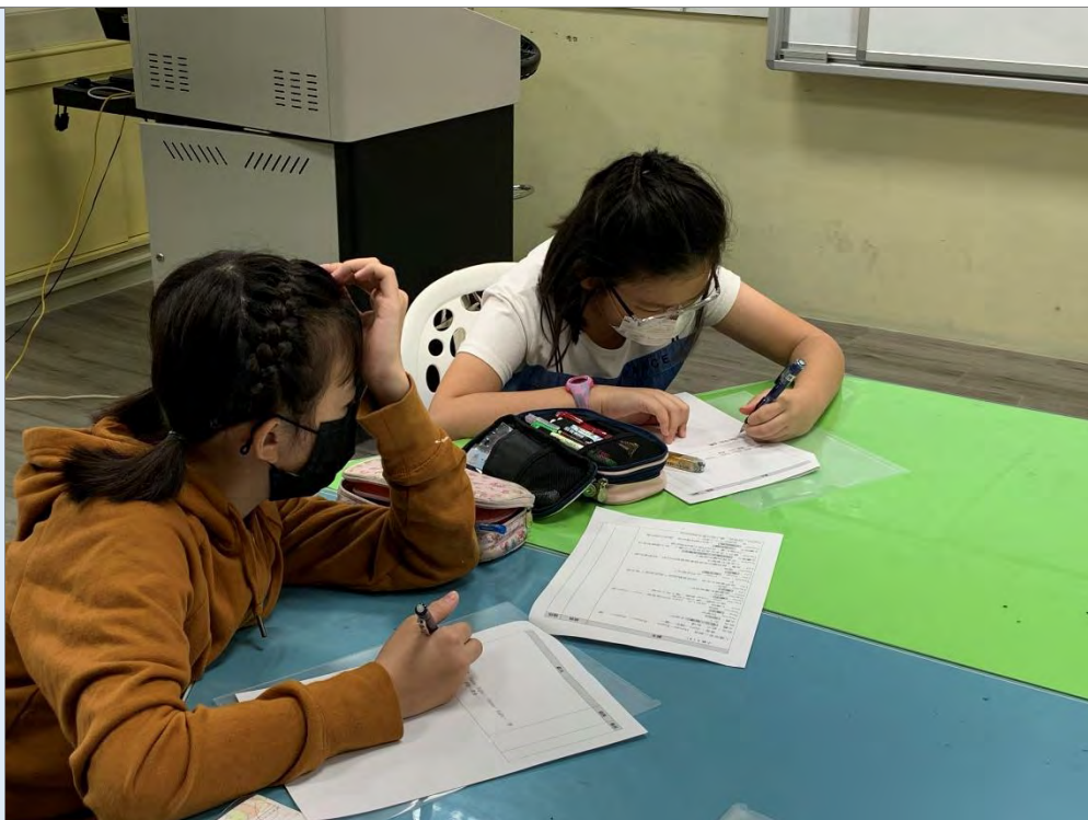
說明：劇本編寫~小組討論