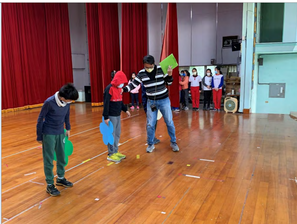
說明：展演彩排走位