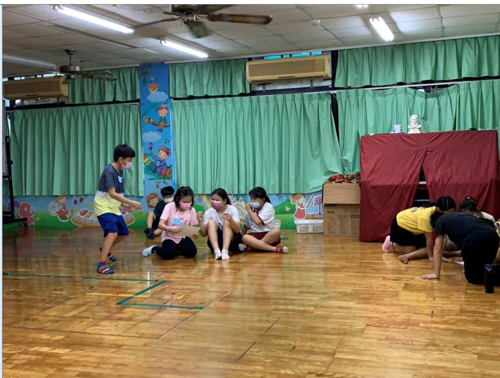
說明：展演技巧練習~讀劇本