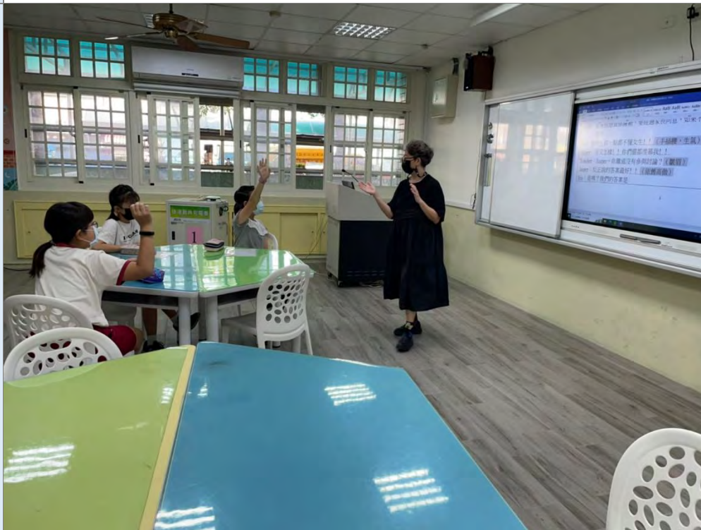
說明：劇本編寫~全劇修改討論